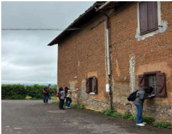
Figura 2. Análisis de un edificio de tierra en Pozzolo Formigaro

Las actividades incluyeron visitas de campo, encuentros con las administraciones locales, la asociación La Frasceta, dedicada a la protección y promoción del patrimonio en tierra, propietarios de edificios y profesionales del sector, creando así un diálogo operativo entre la universidad, el territorio y la comunidad (figuras.2 y 3).