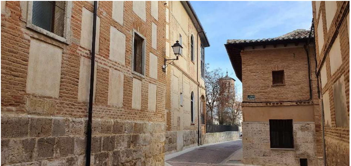
Calle Santa María en Paredes de Nava, Palencia, España, definida por el lateral de Convento de San Francisco y Convento de la Hnas. Brígidas (técnica mixta de tapia encadenada con ladrillo macizo y morteros de tierra en juntas, sobre basamento de piedra) y vivienda particular rehabilitada