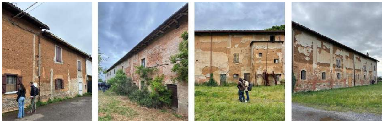
Figura 4. Edificios objeto del análisis de vulnerabilidad (de izquierda a derecha: Case Saraschieri, Cascina Remotta, Cascine Sant'Angelo y Cascina Clavaria)