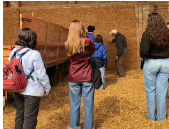
Figura 3. Visita a un edificio de tierra y encuentro con los propietarios

Durante el taller, los estudiantes analizaron cuatro casos de estudio, recopilando datos in situ, realizando levantamientos gráficos y registros fotográficos, y elaborando posteriormente tablas de síntesis y materiales expositivos que se presentarán en una muestra prevista para el fin de marzo de 2026. Los datos se procesaron con el acompañamiento de docentes e investigadores, favoreciendo la formación de una mirada crítica sobre los retos de la conservación, gestión y reutilización de la arquitectura en tierra. La experiencia permitió a los participantes aprender a leer, documentar e interpretar las arquitecturas en tierra directamente sobre el terreno, profundizando en sus valores y fragilidades. Asimismo, supuso un momento significativo de colaboración entre investigadores, docentes, estudiantes y comunidad local,