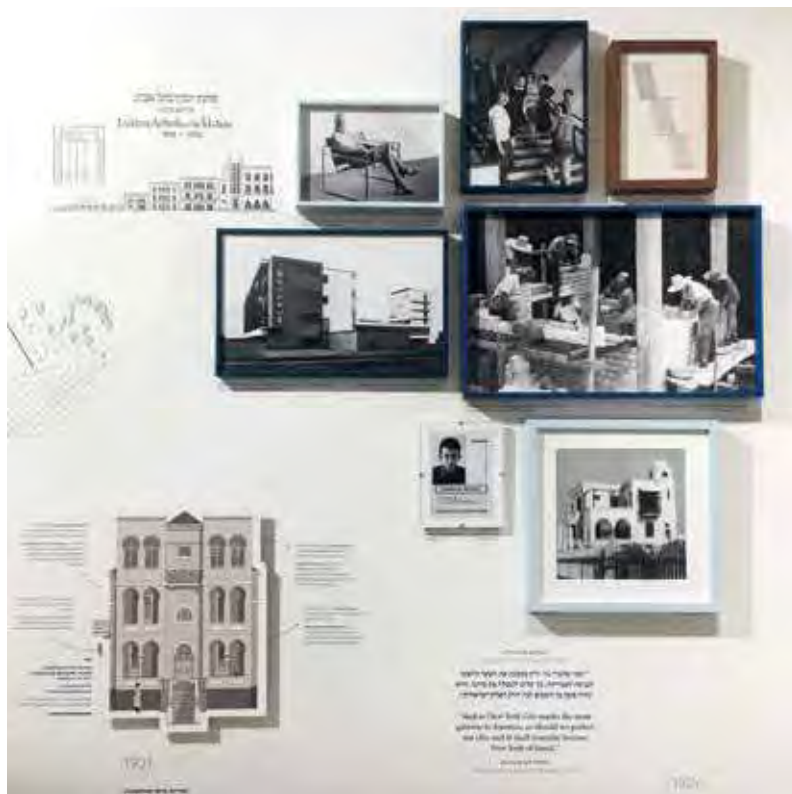
[3] Dettaglio dell'esposizione permanente alla Liebling Haus, Tel Aviv, 2019.

piani dei Robin Hood Gardens di Alison e Peter Smithson (demoliti a partire dal 2017), o alla circolazione internazionale di diverse unità abitative della Nakagin Capsule Tower di Kisho Kurokawa (demolita nel 2022), una delle quali è stata esposta per un anno al MOMA di New York tra il 2025 e il 2026 12 .