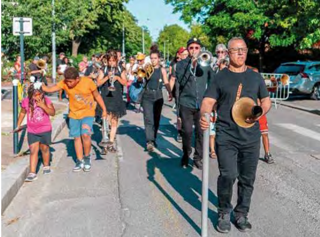
[4] La processione dei tubi a Claveau, Bordeaux, 2022.

il campo dell'azione artistica. A Bordeaux, nella città giardino di Claveau, il lavoro compiuto nel quartiere a partire dal 2015 da un gruppo di artisti, sociologi, storici in coincidenza con l'avvio di un processo di riqualificazione si è tradotto in una campagna di storia dal basso che ha posto al centro della narrazione un elemento problematico per la popolazione, ovvero il cattivo stato della rete fognaria. I tubi di quest'ultima vengono portati ogni anno in una processione che attraversa il quartiere, dando forma a un rituale collettivo che è al tempo stesso occasione di riappropriazione simbolica e di rivendicazione [fig. 4] 14 .