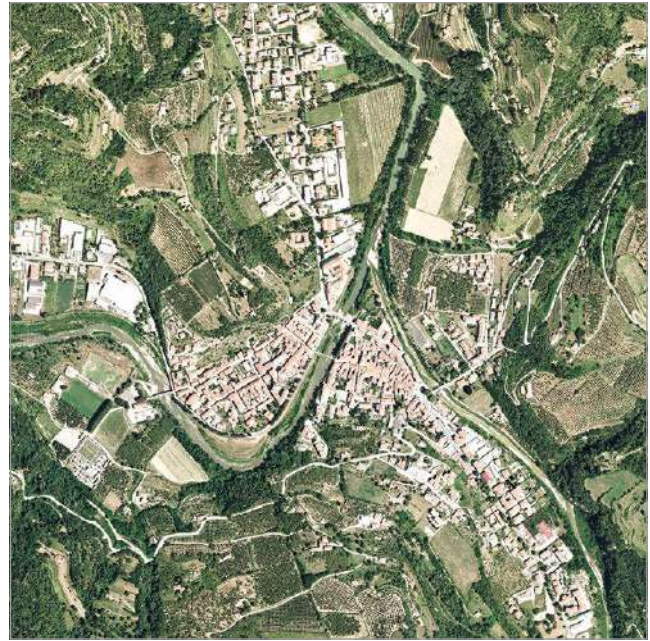
fig. 4 – Ortofoto satellitare del Comune di Cortemilia.