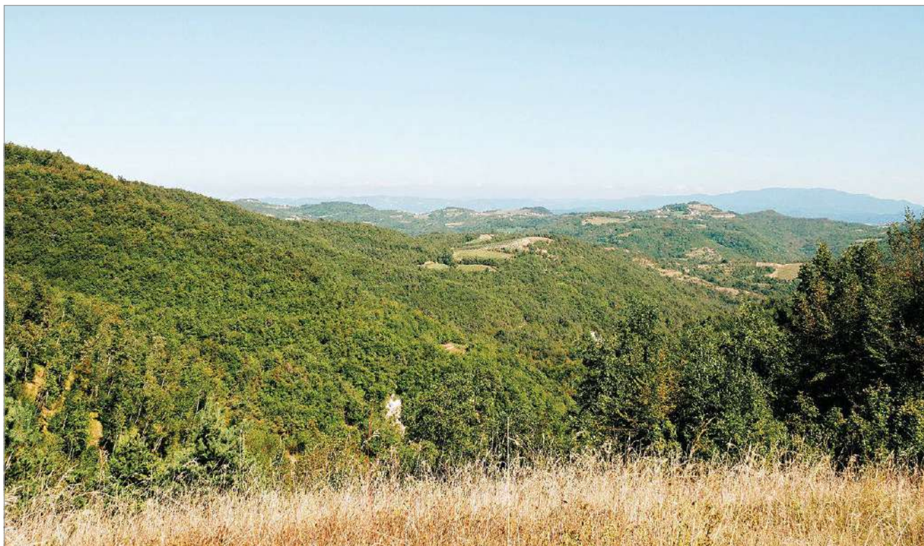
fig. 1 – Il paesaggio della Valle Bormida dal Bricco della Colma (815 m slm), nel Comune di Prunetto. Dalla foto si può notare la conformazione del territorio, con valli profonde formate da pendii particolarmente acclivi che si alternano a pianori di mezzacosta.

condizione rende oggi leggibili forme urbane e relazioni spaziali di lunga durata, conferendo ai centri minori una certa ‘singolarità’ legata proprio al loro abbandono (PIREDDU 2022), ma espone al contempo i centri abitati a nuove fragilità legate alla cronica ‘perdita di corrispondenza’ delle strutture consolidate rispetto alle esigenze contemporanee (Cucco et al. 2023).