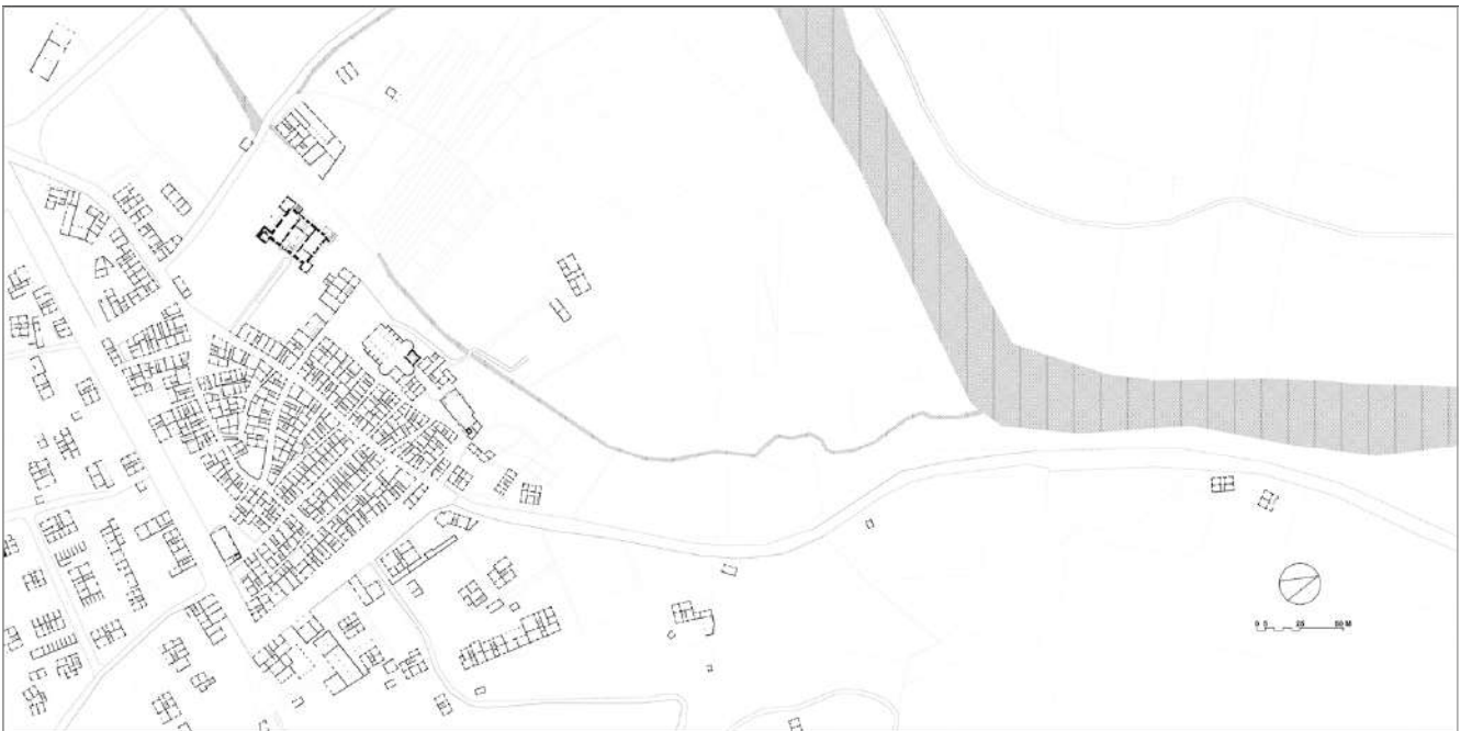
fig. 5 – Pianta tipo-morfologica dei piani terra del centro di Saliceto in relazione con la piana agricola del fiume Bormida. Elaborazione dell'autore.

prevalentemente sul lato occidentale. Nel corso dell'età moderna e contemporanea, il bordo dell'insediamento ha subito una progressiva frastagliatura, accentuata dalla realizzazione della strada veicolare di fondovalle. Quest'ultima si attesta lungo il margine nord-orientale del centro abitato, ricalcando in parte il sedime delle mura medievali, e determina una netta separazione tra il nucleo storico e le espansioni più recenti. La perdita di centralità degli assi di impianto originari, ormai marginalizzati rispetto alla viabilità principale, ha contribuito a uno spopolamento progressivo del centro storico e a una crescita dell'insediamento lungo la fondovalle. Tuttavia, questa nuova cortina