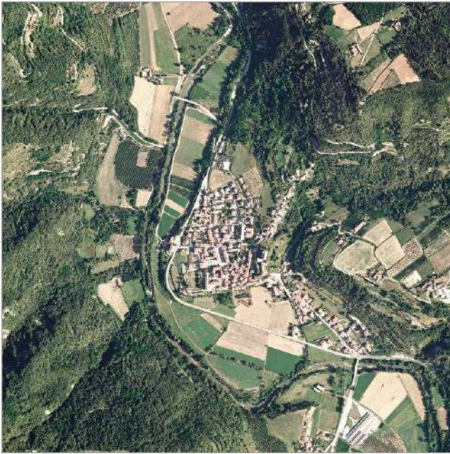
fig. 3 – Ortofoto satellitare del Comune di Monesiglio.