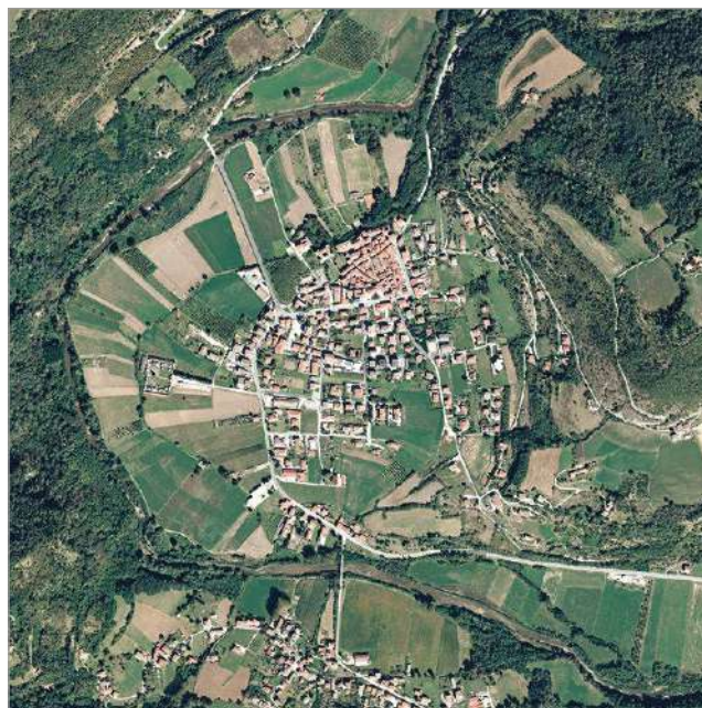
fig. 2 – Ortofoto satellitare del Comune di Saliceto.

La lettura tipo-morfologica ha consentito inoltre di distinguere con maggiore precisione il ruolo degli spazi intermedi all'interno dei tessuti storici. Corti e cortili, spesso derivati dall'integrazione di edifici agricoli e rurali nel tessuto urbano, insieme ai portici, possono essere interpretati come spazi di soglia tra ambito pubblico e privato, capaci di mediare tra la dimensione collettiva e quella individuale attraverso regimi di condivisione dello spazio aperto (STRAPPA 1995). Accanto a questi, passaggi,