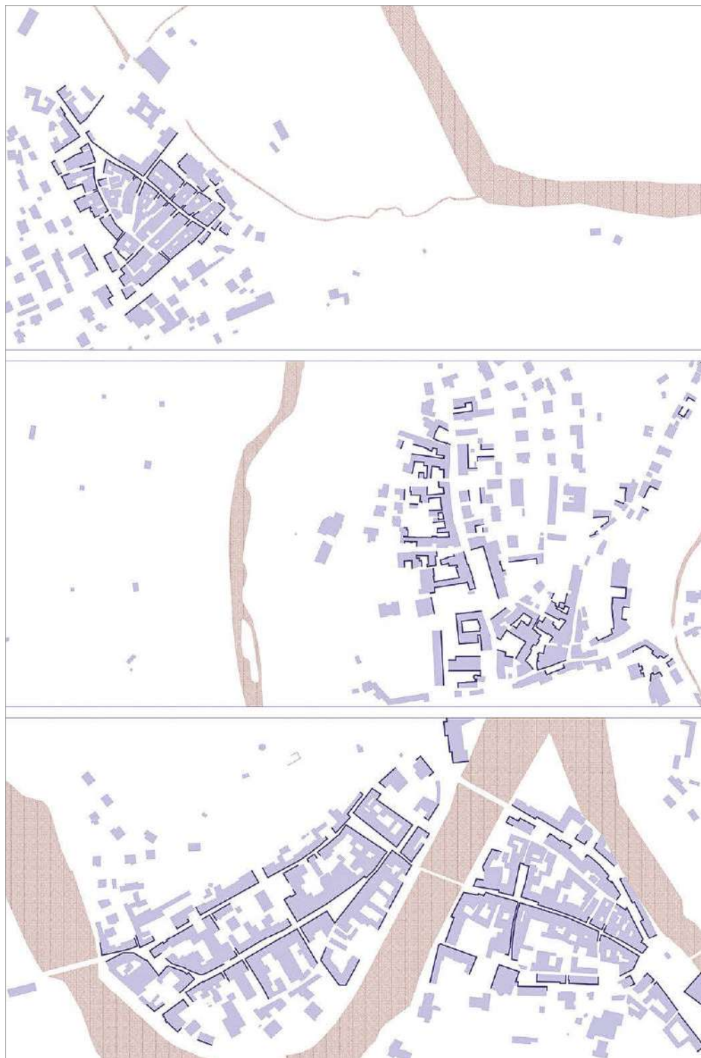
fig. 9 – Diagramma di lettura della percezione di porosità della cortina edilizia in corrispondenza degli assi veicolari. Dall'alto verso il basso: Saliceto, Monesioglio, Cortemilia.

che rischiano di essere percepite come residuali o prive di prospettive (PIREDDU 2022).