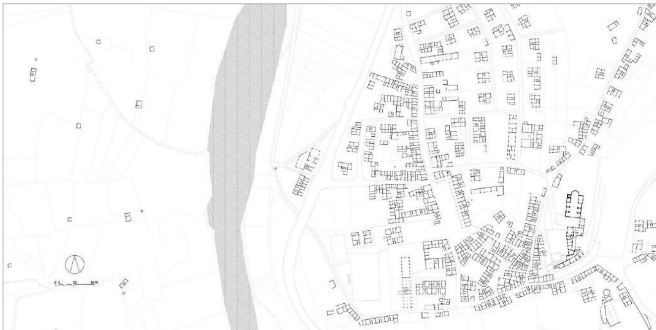
fig. 6 – Pianta tipo-morfologica dei piani terra del centro di Monesiglio in relazione con la piana agricola del fiume Bormida. Elaborazione dell'autore.