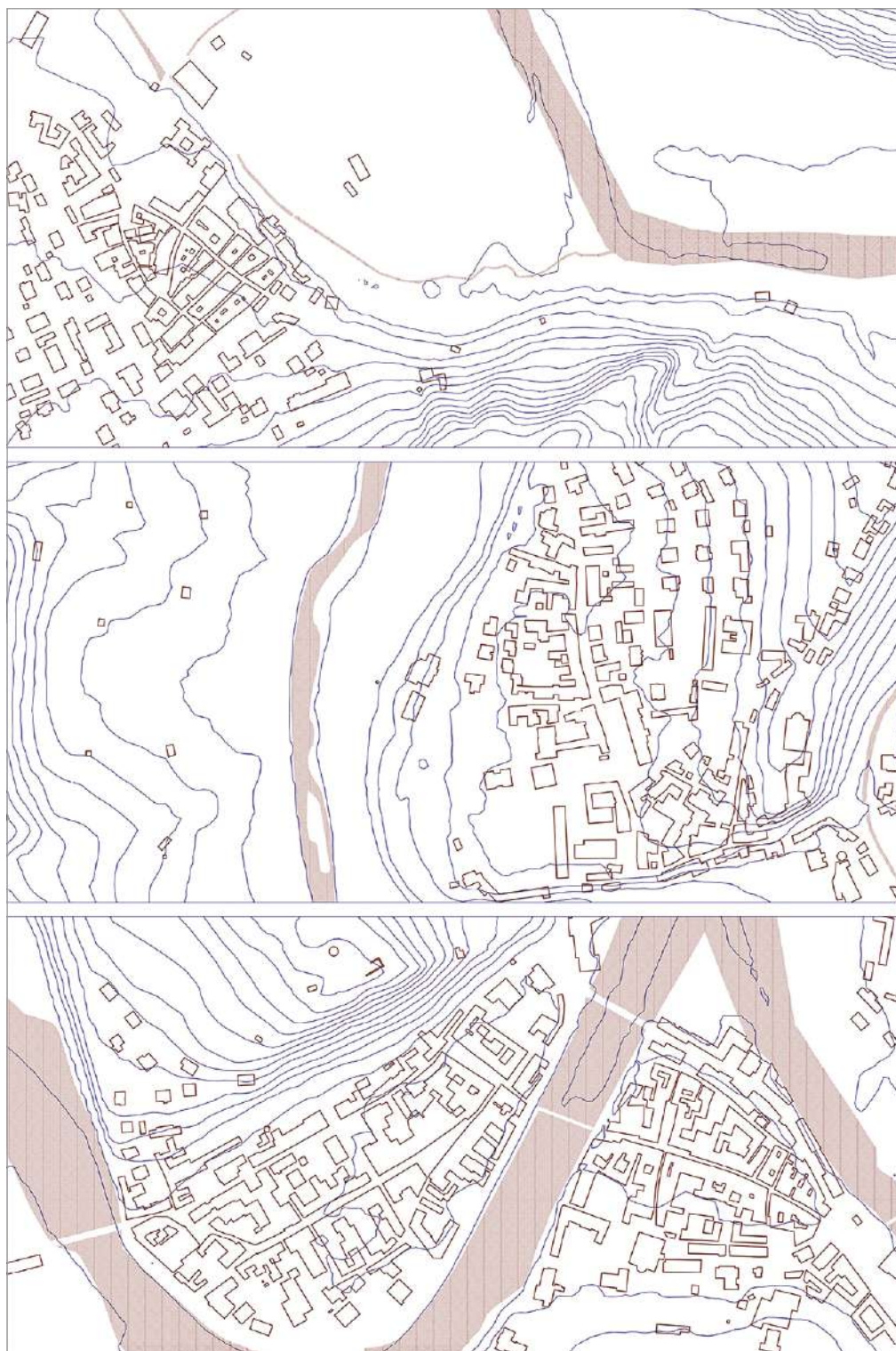
fig. 8 – Diagramma di lettura della relazione tra l'abitato storico e la topografia (le curve di livello sono ogni 5 m). Dall'alto verso il basso: Saliceto, Monesiglio, Cortemilia.

e del progetto viene attribuita un'importanza limitata (Cucco et al. 2023). In questi contesti, il rischio non è soltanto quello di interventi inefficaci, ma anche quello di cancellare tracce materiali e relazioni spaziali che costituiscono una parte rilevante della memoria insediativa e del funzionamento urbano. La lettura tipo-morfologica può contribuire a rendere esplicite queste strutture, offrendo un quadro interpretativo utile a orientare decisioni che altrimenti si fonderebbero su criteri esclusivamente funzionali o contingenti.