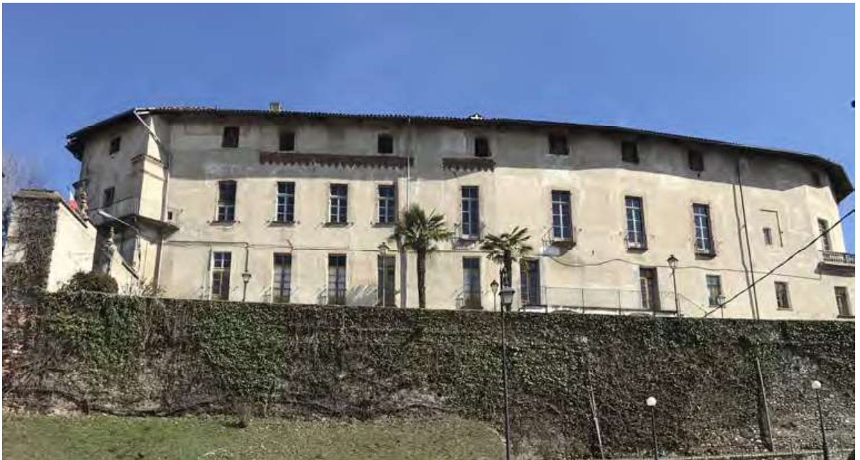
Fig. 2. Foglizzo. Castello, fronte ovest, 2023.