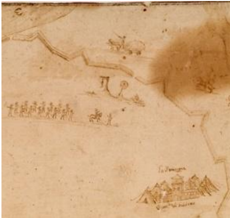
Fig. 2- Particolare dell'immagine precedente

Al di fuori della piazza d'armi, nei pressi della cascina Stampina il quartiere dell'Al[tezza] S[erenissima] di Mantova. Nei pressi della cascina detta Stortigliona è accampato Alfonso Perez de Vivero, conte di Fuensaldagna.