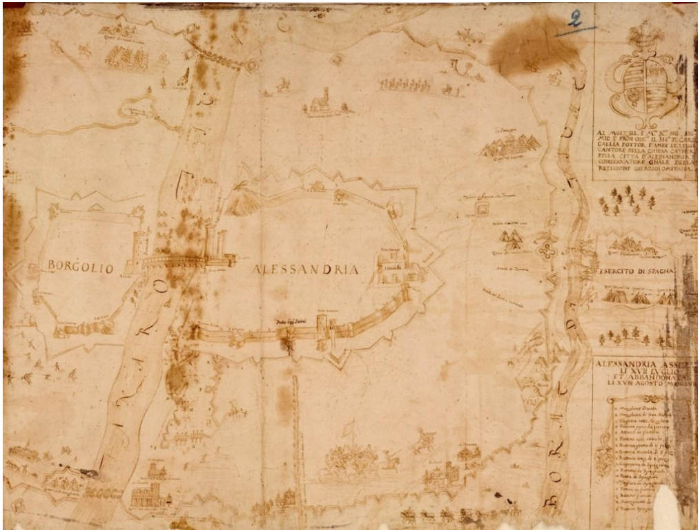
Fig. 1- G. F. Pert, Alessandria assediata li XVII luglio et abbandonata li XVIII agosto MDCLVII , s.d. post 1657 (ASAI, ASCAI, serie III, 2262/2)