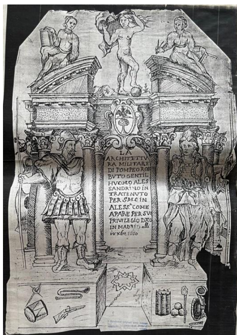
Fig. 4- L'Architettura Militare di Pompeo Robutto gentiluomo [...] , Madrid 1650, (ASAL, ASCAL, serie III, cart. 1957)

matematica applicata, l'espugnazione delle fortezze, i ruoli e le competenze necessarie per i diversi soldati. Fra i molti capitoli si ricorda Dell'offesa delle piazze, Del modo di fortificare li quartieri, Delle porte sua struttura e qualità, Della cognitione del sito fortificabile, Dichiarazione di alcuni principi di architettura militare . È inoltre presente, in lingua latina, spagnola e italiana, un elenco dei termini usati per indicare i singoli componenti delle opere fortificate e di ogni termine è data una breve descrizione perché: "In ogni professione è necessaria la cognizione di termini con li quali si esprime la natura delle cose che concorrono all'intelligenza di quest'arte che però si giudica necessaria la nomia dell'Archit. Militare soliti usarsi nel describer la pianta e profilo d'una fortezza il che si farà in tre linguaggi italiano, Spagnolo, Latino [...]": Robutti indica nelle pagine iniziali i "Nomi degli scrittori de quali si è servito l'Autore in quest'opera": tra gli altri Vitruvio, Euclide, Sebastiano Serlio, Galeazzo Alessi, Platone, Giulio Cesare, Vegetio, Pietro Antonio Barca, Giuseppe Barca. Non mancano i riferimenti al sistema fortificatorio di matrice olandese.