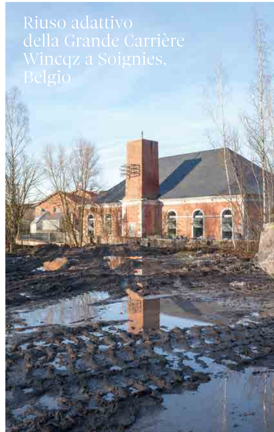
↑ The Grande Scierie as seen from the active mining site