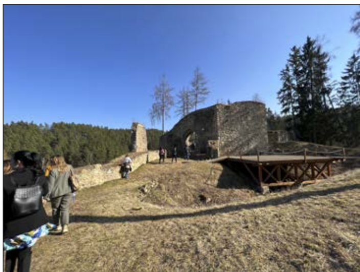
Fig. 2. Castillos del río Malše, Sur de Bohemia (República Checa).

de las Buenas Prácticas 7 se presentaron directamente desde los lugares donde se implementaron, como fue el caso del Festival de Música Antigua de Daroca (Zaragoza) o el plan de desarrollo patrimonial del complejo agrícola «Maarhuizen» en Groninga (Países Bajos) permitiendo además que los propios agentes a cargo de la Buena Práctica la presentasen en primera persona.