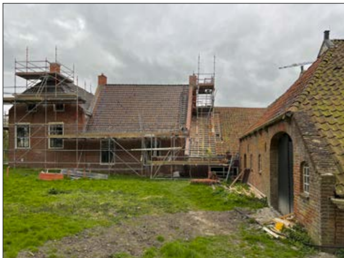
Fig. 3. Trabajos de restauración en Maarhuizen, Groninga (Países Bajos).

Uno de los temas clave que emergió de estas discusiones fue la importancia de un adecuado seguimiento de las inversiones realizadas en infraestructuras y equipamientos patrimoniales. La experiencia mostró que, en varios casos, la simple inversión en restauración o mejora de los recursos patrimoniales no es suficiente para garantizar su sostenibilidad o impacto a largo plazo. Por ello, se subrayó la necesidad de desarrollar y ejecutar planes de uso y dinamización de estos recursos una vez concluidas las inversiones, para asegurar su integración activa en la vida cultural y económica de las comunidades locales.