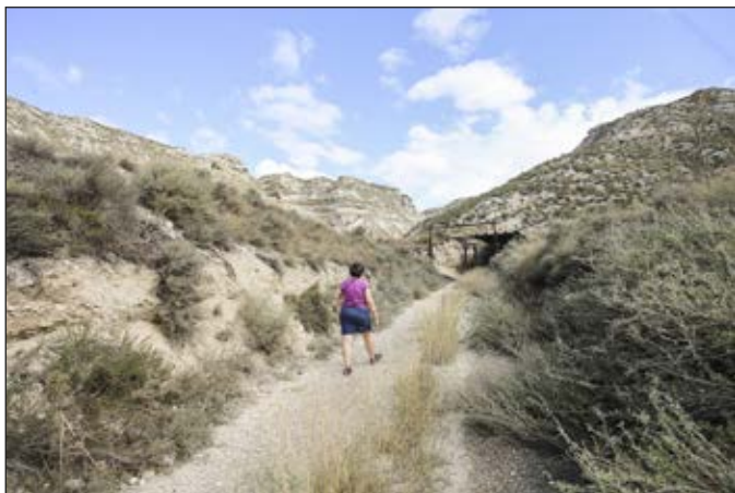
Fig. 4. Visita técnica a las minas de sal de Remolinos (Zaragoza, España).

la inclusión de una línea de financiación específica en el presupuesto anual de la Diputación para planes de Gestión del Patrimonio asegurando la continuidad del proyecto. Estas iniciativas se acompañaron con una serie de visitas abiertas al público general para dar a conocer la potencialidad del patrimonio salinero en la provincia y la publicación de un estudio. 9