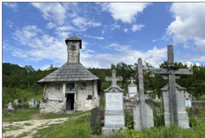
Fig. 1. Iglesia de madera «San Nicolás» de Selișteea, en el distrito de Mehedinți (Rumanía).

camente en los logros del pasado, sino también en crear nuevas oportunidades para que las áreas rurales se conecten con las urbanas a través de iniciativas culturales. El CESE instó a apoyar actividades como festivales, ferias artesanales, visitas escolares a zonas rurales y días de puertas abiertas en granjas, para que los ciudadanos urbanos puedan comprender mejor la vida rural y desarrollar un mayor aprecio por el patrimonio de estas zonas.