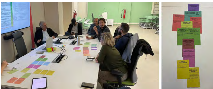
Fig. 2 - Seconda parte del workshop per la selezione degli indicatori per la dashboard (sx) e selezione finale degli stakeholder (dx) / Second part of the workshop to select indicators for the dashboard (left) and final selection of stakeholders (right).

The “priority” indicators were selected through an online questionnaire, which collected 24 responses from the actors present. Based on the first selection, a second skimming and validation process was carried out in an in-person workshop through the playing card method (Figueira and Roy, 2001). The most important indicators were selected in terms of climate-altering emissions, quantity and quality of green spaces, waste generation and collection, air quality, and microclimate. The third