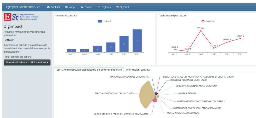
Fig. 1. Homepage dashboard interattiva DIGIMPACT

La dashboard è organizzata in cinque pagine tematiche e interattive. Oltre alla pagina principale dei contratti è possibile consultare: la pagina con le mappe interattive della posizione geografica dei fornitori e delle province richiedenti i contratti; la pagina dedicata ai fornitori e alle loro informazioni societarie ed economiche oltre alla rappresentazione grafica del CR ratio; la pagina DigiPivot che permette di consultare nel dettaglio lo stato di digitalizzazione degli enti considerati dal monitoraggio; infine, la pagina DigIndex dedicata alla consultazione del punteggio degli enti su una mappa interattiva.