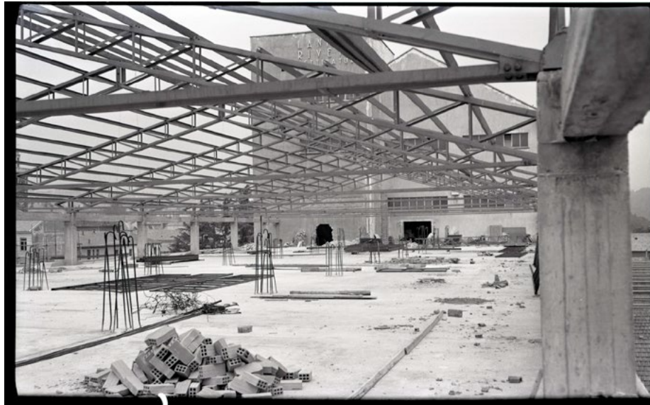
Fig. 2. Ampliamento dello stabilimento nel 1960; cantiere durante l'intervento di copertura e di collegamento con il corpo preesistente; sono evidenti le rotture in facciata della torre di testata per la continuità di percorso orizzontale fra i due corpi di fabbrica.