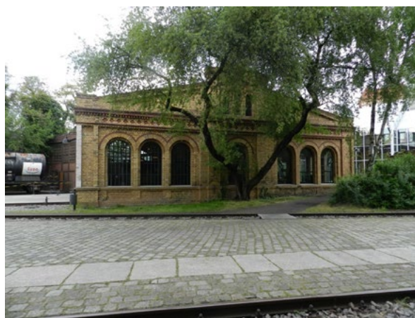
Figg. 5-6. (a sinistra) La rimessa ferroviaria circolare dell'ex-Anhalter Bahnhof, ora parte del Museo Tedesco della Tecnica. (foto di Manuela Mattone). (a destra) La facciata della rimessa ferroviaria circolare dell'ex-Anhalter Bahnhof (foto di Manuela Mattone).