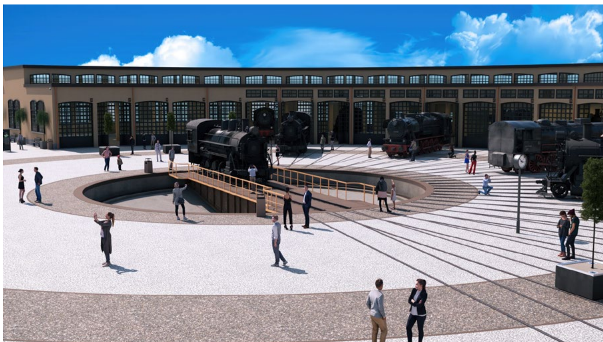
Fig. 2. Render d'insieme del Progetto di valorizzazione della rimessa TD di Torino Smistamento.