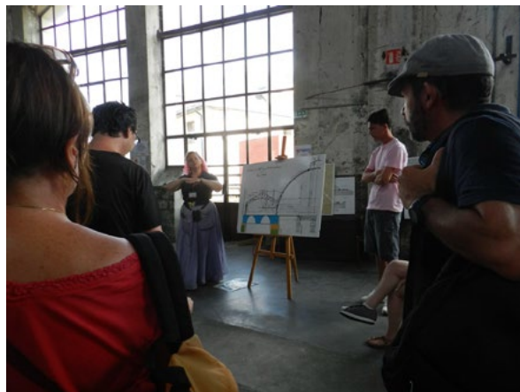
Figg. 3-4. (a sinistra) Deposito ferroviario detto rotonde di Chambéry, vista dell'edificio. © Peyre, Dominique / Région Auvergne-Rhône-Alpes, Inventaire général du patrimoine culturel, 1982. (a destra) Rotonde Ferroviaire , Chambéry. Visita guidata del complesso (foto di Manuela Mattone).