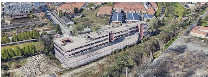
Fig. 1. Vista aerea dell'area dell'ex "Centro di smistamento postale" di via Monteverdi a Torino (Google Earth).

dell'identità visiva è essenziale, con la riassunzione del ruolo paesaggistico e la ricostruzione di un ecosistema vegetativo includente la valorizzazione delle permanenze storiche del canale e della ferrovia. Tali potenzialità richiedono, inoltre, di riconsiderare il vincolo urbanistico e cimiteriale (che ha per ora bloccato l'ipotesi di uno studentato con uffici di logistica, formulata dallo studio PICCO nel 2018-2019) e di affrontare le valenze e le peculiarità del sistema edificio (Fig. 1).