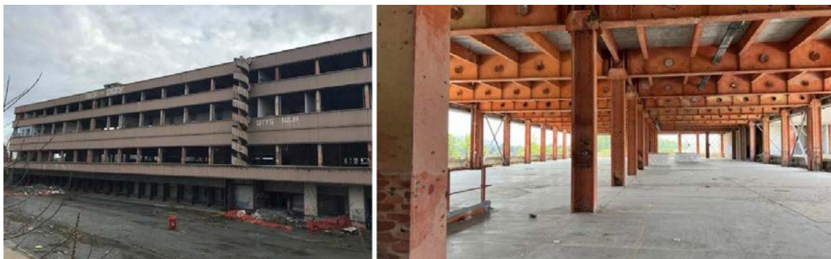
Fig. 2. Vista dell'edificio da via Monteverdi (Torinoggi.it, 3 febbraio 2020) e particolare del sistema strutturale ( www.piccoarchitetti.it/projects/poste-monteverdi-studio-di-fattibilita-2/ ).

L'ex "Centro di Smistamento Postale" 4 presenta un sistema strutturale innovativo, con una maglia interna di grande dimensione, variabile in funzione dei carichi previsti. La scandiscono pilastri metallici HEA, con travi principali a comparti con bucaure centrali per gli impianti e nervature in corrispondenza dei travetti secondari a sezione metallica piena e solai in lastre prefabbricate in cemento armato. La sperimentazione si inserisce in un filone del 2° Novecento della costruzione in acciaio italiana, dall'azione pionieristica dell'Italsider alla diffusione di sistemi di "prefabbricazione" (come il FEAL) e di "industrializzazione" per la grande costruzione fondata ancora su un sapere artigianale (Fig. 2).