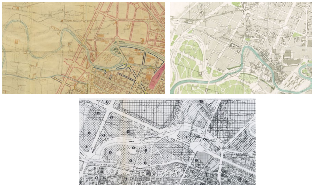
Figg. 1-3. L'area a sud-ovest del Castello di Lucento, poi Fiat Bonafous (poi Teksid e poi ThyssenKrupp), tra le borgate Lucento e Ceronda, la strada provinciale di Pianezza e il fiume Dora nel 1908, nel 1945 e nel 1959.

L'acciaieria Fiat Ferriere Lucento (stabilimento Italsider, poi Teksid, infine ThyssenKrupp) raggiunge la dimensione di circa 300 mq – inclusi gli spazi aperti di pertinenza -, generando anche l'inalveamento della Dora Riparia (l'ansa del fiume oggi abbraccia il Parco di via Calabria) 5 e una bretella ferroviaria, che passando sotto il corso Potenza, collegava le Ferriere di Lucento all'area dei Grandi Nastri (le Ferriere di via Nole di borgata Ceronda).