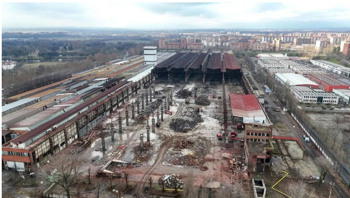
Fig. 5. Area ThyssenKrupp: demolizione dei fabbricati ex Fiat Ferriere Bonafous (“Torinoggi.it”, 29 maggio 2025).

Tutto sembrerebbe portare verso una rigenerazione sostenibile, almeno da un punto di vista ambientale. E tuttavia molte perplessità restano, a partire dalla separazione ormai avvenuta di due aree storicamente e urbanisticamente legate fra loro (ThyssenKrupp e Bonafous per una superficie tot. di ca. 330.000 mq) alle prospettive di parziale e, per molti, insufficienti lavori di bonifica previsti, fino ai servizi pubblici cui l'area dell'ex-ThyssenKrupp dovrebbe assolvere.