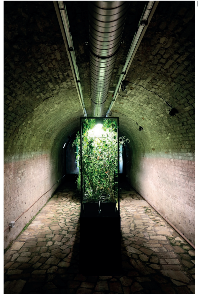
02 | Vertical farm in un Tunnel – Filippo Oppimitti, 2024

"Leaf, that gently fell to the breeze beneath my feet, with a soft call perhaps you complain that I tread on you. While you were alive on your green branch, I often passed by, and thought nothing of you; dead, I think of you, and feel that I love you."