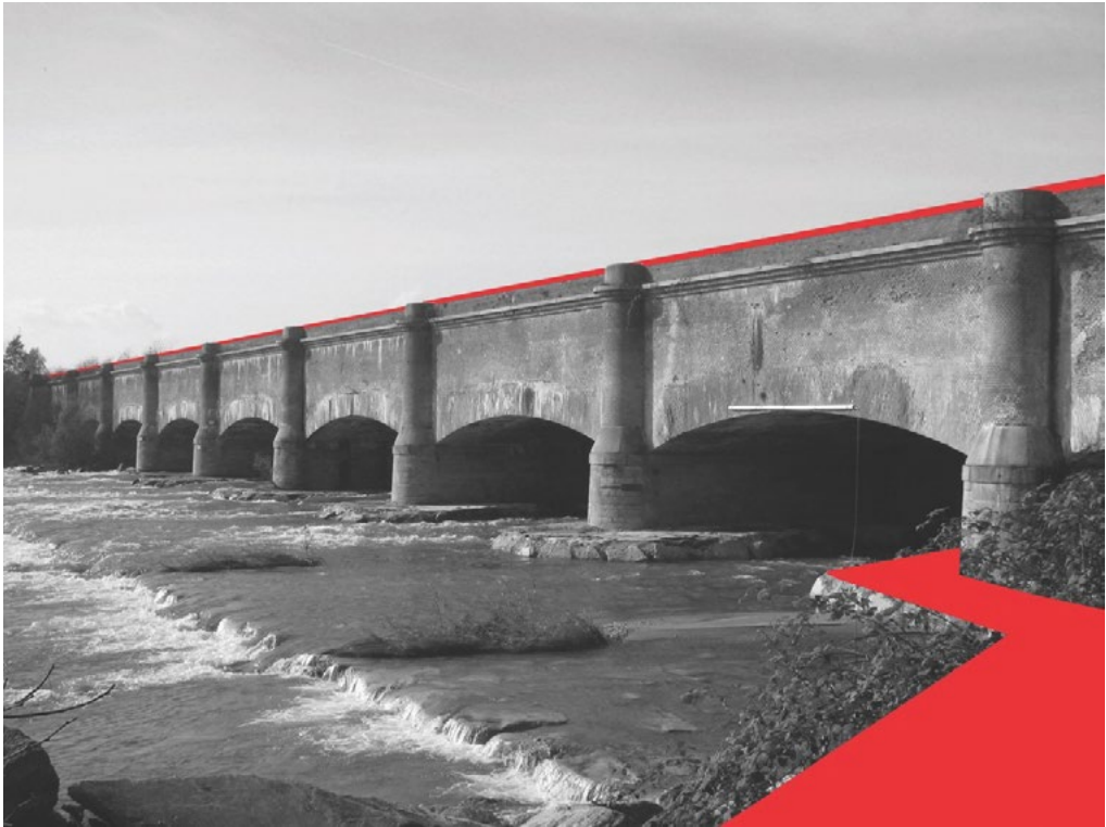
4: C. Occeili, R. Palma, Il ponte canale sulla Dora Baltea a Saluggia: simulazione del tracciato della ciclovía del Canale Cavour.

Un ultimo aspetto, rimasto sin ora implicito in questo scritto, riguarda la coltivazione del riso, cui il Canale è funzionale, e il territorio che essa costruisce; a tale riguardo Mead scrive: