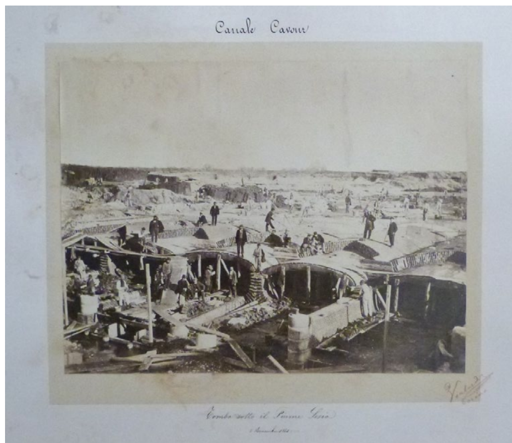
3: Tomba sotto il Fiume Sesia.

L'ingegnere sottolinea gli aspetti di similitudine e di diversità tra i territori del Canale Cavour e quelli della Valle del fiume californiano: «This valley of the Po is like our own of the Sacramento in size and form and disposition of water-ways, but is much better supplied with streams, draining and adjoining mountains (...)» [Hall 1886, 183], per