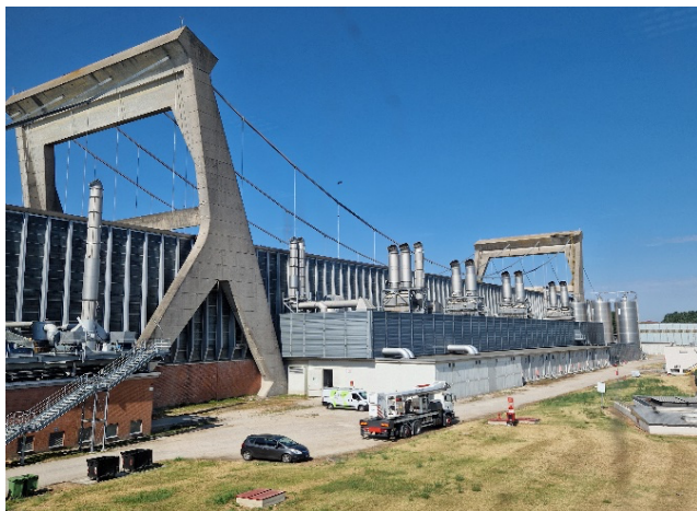
Fig. 1 La ex-cartiera Burgo di Mantova come si presenta oggi.