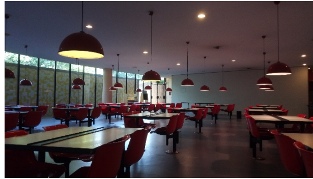
Fig. 4 Il locale della mensa dei dipendenti al piano seminterrato prima dell'intervento (foto D. Rolfo, 2022).

dell'originario open space. Il soffitto è stato parzialmente abbassato mediante l'inserimento di un controsoffitto che cela gli impianti utili a garantire il necessario comfort termico degli ambienti. L'adeguamento energetico del complesso ha richiesto la sostituzione di tutti i serramenti esterni, riproponendo geometrie e colori originali. Unica eccezione, le vetrate colorate della hall, che sono state conservate inserendo un nuovo serramento esterno, onde migliorarne le prestazioni termiche. Integrazioni sono state previste anche in corrispondenza delle scale di sicurezza esterne intervenendo sui mancorrenti per garantire il rispetto delle prescrizioni normative.