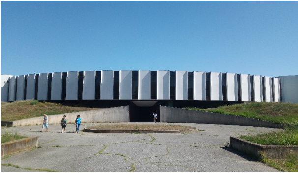
Fig. 3 L'ex sede amministrativa delle Cartiere Burgo prima dell'intervento.