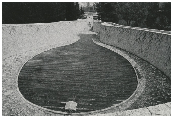
Fig. 2 Mostar, Cimitero e Memoriale dei Partigiani. Lo scorrere dell'acqua unisce i vari livelli del progetto e richiama idealmente il fiume Neretva: dalla sorgente situata sulla terrazza più alta, alla fontana ai piedi del monumento. Inventory number: N05-031-002-F_85