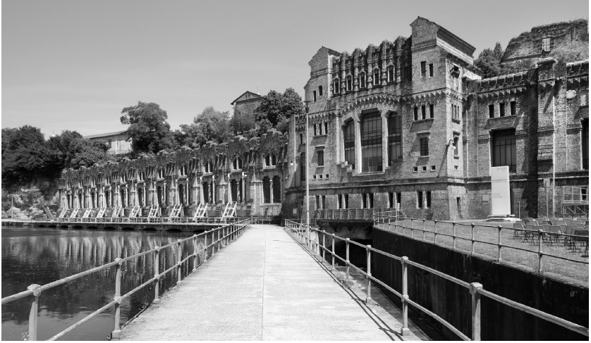
Fig. 02. Gaetano Moretti, Centrale idroelettrica Taccani, Trezzo sull'Adda (MB), 1906. Centrale attiva.