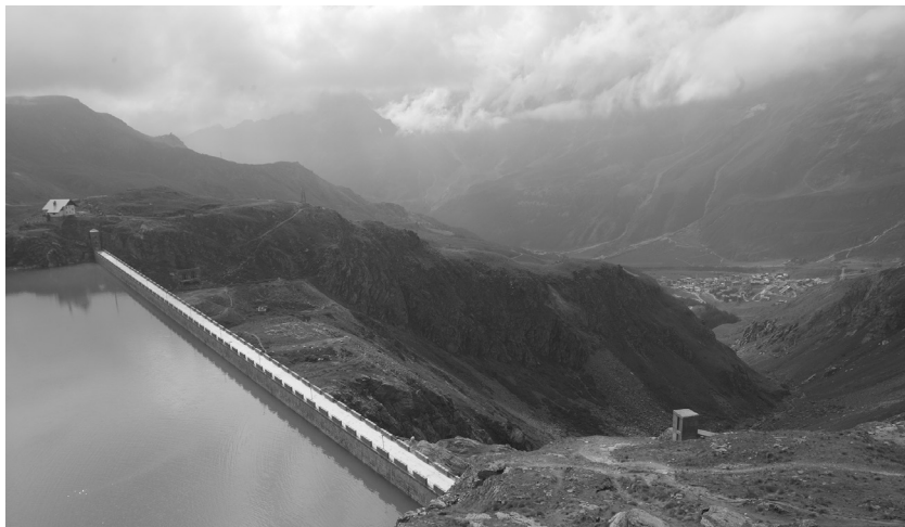
Fig. 04. Diga del Goillet, Valtournenche Valtournenche (AO), 1939-1947, collaudo 1952. Capacità utile di invaso: 11.159.000 m 3 ; tipologia della struttura: a gravità in massiccia.