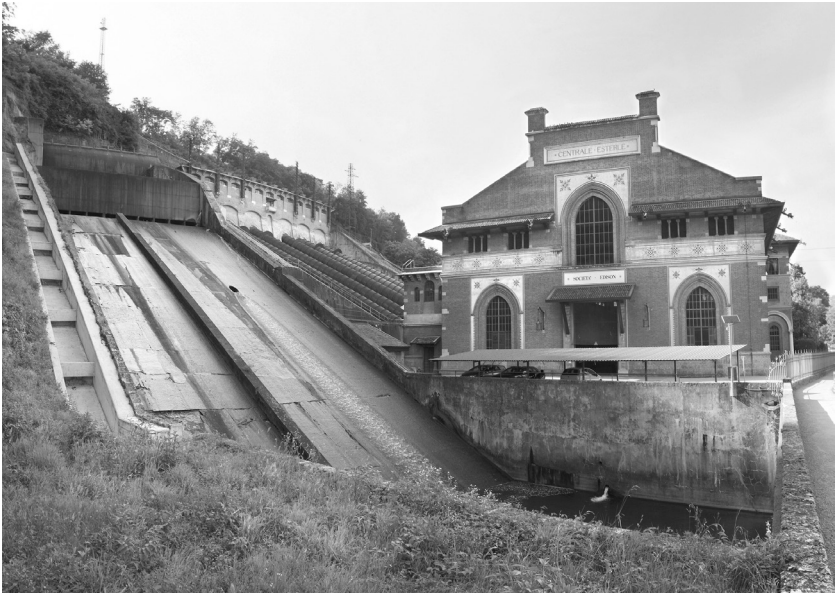
Fig. 03. Centrale idroelettrica Esterle, Porto d'Adda di Cornate d'Adda (MB), 1906-1914. Centrale attiva.