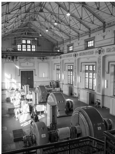
Fig. 05. Centrale idroelettrica Champagne I, Villeneuve (AO), 1921-1929. Centrale attiva.