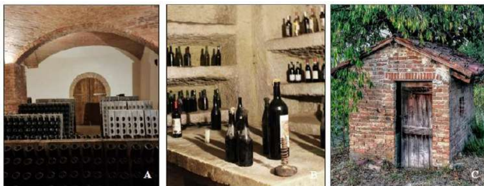
Fig. 2 Le architetture rurali minori nei paesaggi vitivinicoli del Piemonte: Langhe-Roero e Monferrato. Rispettivamente: A) Cattedrali sotterranee; B) Infernot e C) Ciabòt. (Alessandra Renzulli, 2025)

Colonna A: core zone 1 'La Langa del Barolo'; B: core zone 2 'Il Castello di Grinzane Cavour'; C: core zone 3 'Le colline del Barbaresco'; D: core zone 4 'Nizza Monferrato e il Barbera'; E: core zone 5 'Canelli e l'Asti spumante'; F: core zone 6 'Il Monferrato degli infernot'. (Alessandra Renzulli, 2025)