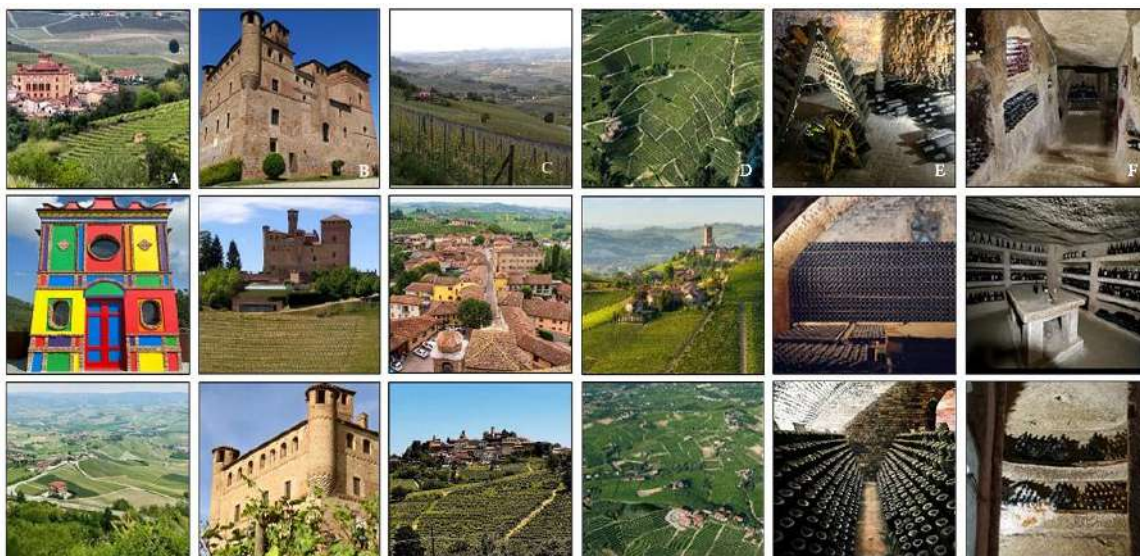
Fig. 1 Le sei core zone del paesaggio vitivinicolo delle Langhe Roero e Monferrato.

rappresentano gallerie e spazi ipogee scavati nella pietra, destinati alla conservazione del vino per usi produttivi e domestici. (Fig. 2)