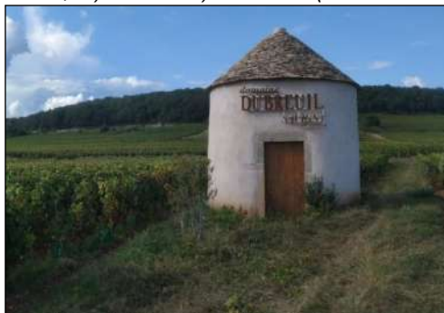
Fig. 5 Il restauro dei cabottes per la mise en scène paysager. (Alessandra Renzulli, 2025)