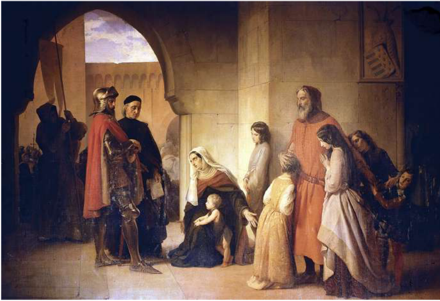
1.1 Francesco Hayez, Alberico da Romano, fratello di Ezzelino, si dà prigioniero con la sua famiglia al Marchese d'Este , 1845. Milano, collezione privata.