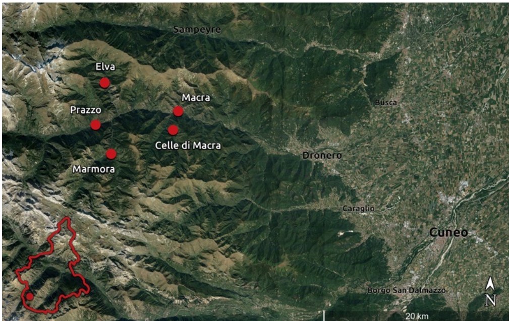
3: Sofia Darbesio, I cinque comuni che compongono l'ecomuseo dell'Alta valle Maira, 2023. [Rielaborazione grafica dell'autrice su base Google Earth 2022]

Si può affermare quindi che in questa realtà sia la percezione comune di sentirsi parte di un'unica tradizione culturale, quella occitana, a favorire lo sviluppo di strategie partecipate e permettere la salvaguardia del patrimonio del territorio in modo socialmente condiviso.