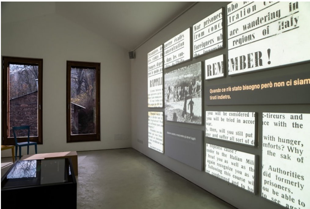
2: Federico Bernini, Lo spazio interattivo del museo dei Racconti all'interno di una delle baite recuperate.

Il caso di Paraloup risulta quindi d'interesse sotto molteplici aspetti: da un lato è un esempio di ripopolamento e di salvaguardia bottom-up del patrimonio rurale alpino attraverso un progetto di recupero sostenibile e consapevole volto alla riattivazione dell'economia rurale montana; dall'altro rappresenta l'identificazione e la narrazione di una memoria collettiva, col fine di trasmettere frammenti di storia che altrimenti sarebbero andati perduti.