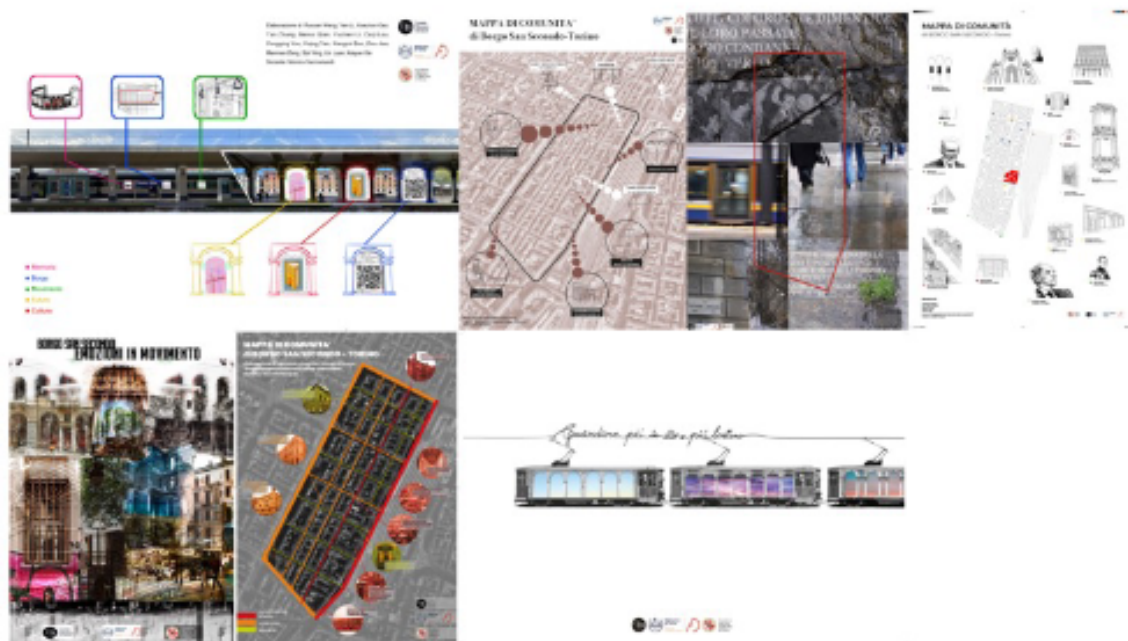
5: Accademia Albertina di Belle Arti di Torino AABA, Scuola di Decorazione, indirizzo Public Art, AA 2022-23. Scenari di Mappa di Comunità, Borgo San Secondo, Torino, 5-6.2023. [Accademia Albertina, Comitato Rilanciamo via Sacchi]

Lo studio mostra come l'arte murale abbia ruolo sia per l'attivazione di processi di coinvolgimento della comunità patrimoniale, sia per il ri-sviluppo locale, stimolando forme di cooperazione pubblico-privato.