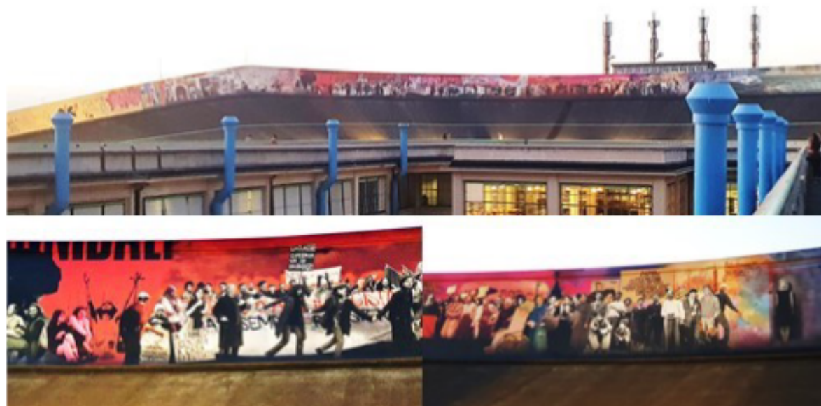
3: Pistarama, Dominique Gonzalez-Foerster, commissionata dalla Pinacoteca Agnelli, 2023. [Maspoli R.]

linguistica – con l’uso del collage – e un progetto di place branding, in cui l’appropriazione urbana diviene museizzabile . L’opera artistica va oltre gli interventi di libera espressione e opposizione sulla dismissione degli impianti abbandonati – come le prime esperienze del Bowery Wall Mural di Keith Haring a New York – o le tracce lungo l’ex muro di confine a Berlino, divenuti in seguito icone urbane in continua evoluzione.