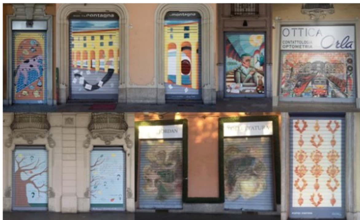
4: Portici d'Artista. Selezione opere realizzate, Borgo San Secondo, Torino, 2021-22 [Comitato Rilanciamo via Sacchi].

In termini di Neighborhood Branding , lo sviluppo artistico dei bozzetti preliminari e delle mappe ha iniziato con il considerare l'entità dei prodotti del luogo emersi