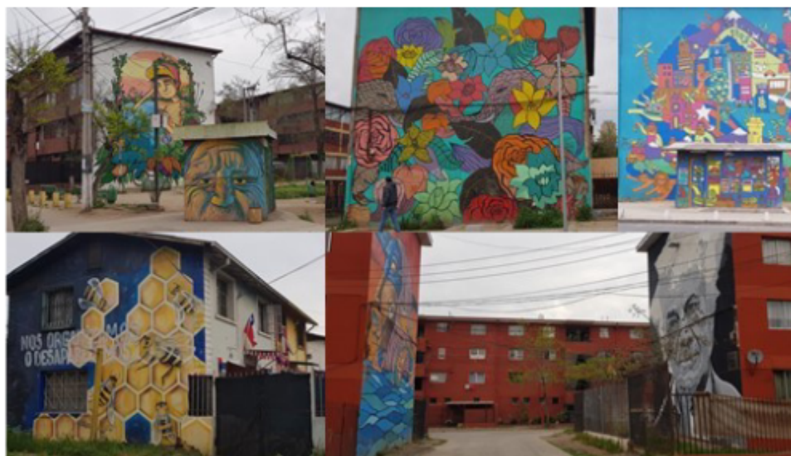
2: Museo a Cielo Abierto en San Miguel, Santiago del Cile, 2018. [Maspoli R.].

L'arte pubblica ha ruolo nel piano complessivo di restauro architettonico e local branding per le 27 campiture murali "Wall Surfaces" di David Tremlett, che connotano i corpi secondari del Complesso Monumentale di Santa Chiara e San Francesco della Scarpa a Bari (2019). Sono sviluppate secondo il tema del viaggiare, in cui le scansioni geometriche di segni del paesaggio si adeguano alle partizioni murarie esistenti. Alla committenza pubblica si affianca il coinvolgimento del territorio attraverso la collaborazione degli studenti dell'Accademia di Belle Arti di Bari.