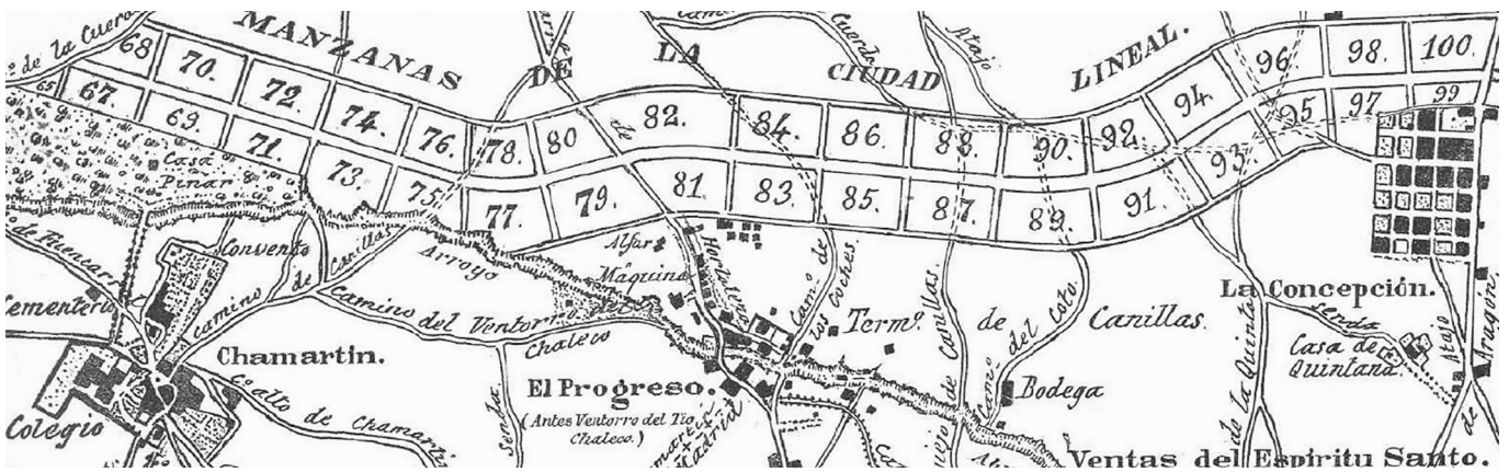
1. Compañía Madrileña de Urbanización, Progetto di lottizzazione della Ciudad Lineal. [1897] (Madrid, Archivo Privado de la CMU, Colección de Impresos).