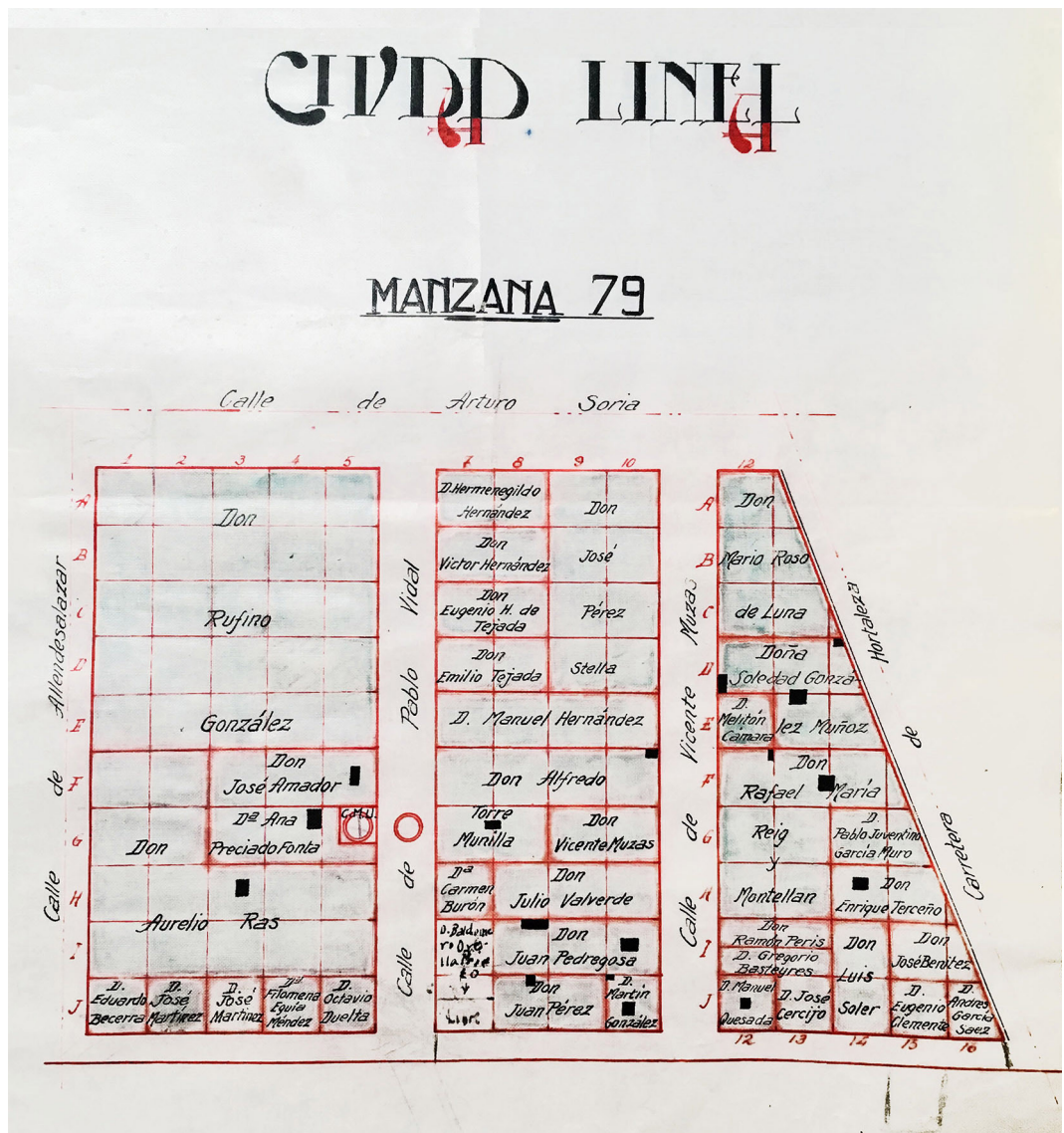
2. Compañía Madrileña de Urbanización, Manzana 79 della Ciudad Lineal con l'indicazione dei lotti e dei diversi proprietari, [post 1930] (Madrid, Archivo Privado de la CMU, Terrenos).