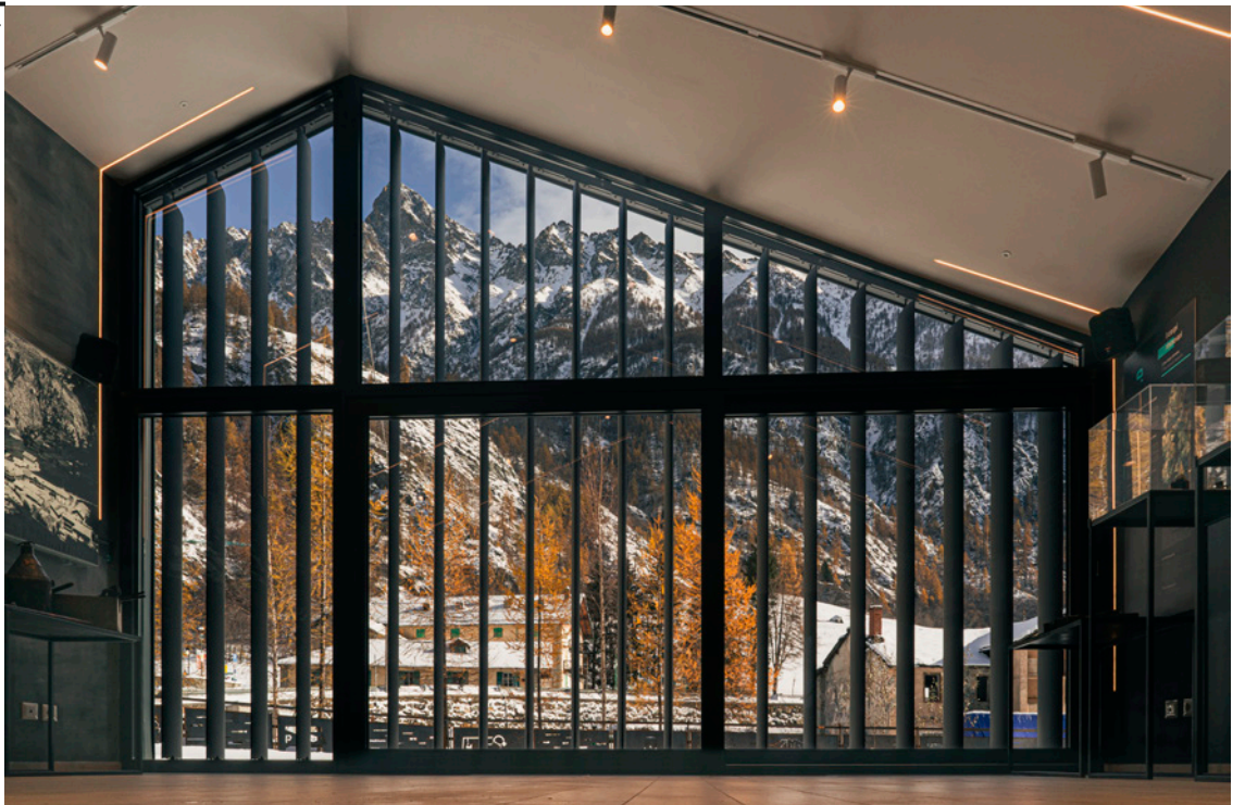
Fig. 4 Internal view of the pavillion.