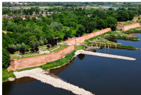
Fig. 2- Il progetto Baltic For Route: il polo strategico della fortezza Kustrin, Polonia.

Nel progetto Baltic for Route la cooperazione ha avuto luogo sotto gli slogan "Dalla guerra alla pace", "Dal mistico e sconosciuto ai luoghi pubblici" e "Dalle aree militari alla cultura". Supportato da programmi e fondi dell'UE, questo percorso offre una serie di attrazioni per tutte le generazioni e i tipi di visitatori, attraversando quattro paesi baltici: Germania, Polonia, Lituania e Russia. Lungo lo stesso percorso i visitatori possono ammirare patrimoni difensivi straordinari e significativi per tipologie e particolari costruttivi (feritoie, torri, bastioni, ecc.), che accolgono un quadro eterogeneo di eventi culturali, parate militari, festival all'aperto o incontri di motociclisti, spesso localizzati in contesti naturali, oltre alla pesca, aperti alla fruizione e ad accogliere attività per il tempo libero. Inoltre, queste fortezze promuovono l'arte e la cultura sotto forma di concerti, rappresentazioni teatrali, rievocazioni storiche e mostre.