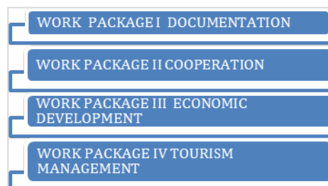
Fig. 4- Baltic For Route: i 4 Work Packages (elaborazione grafica di Cristina Coscia, 2024).

Infine, il Work Package IV promuoveva la realizzazione di un nuovo percorso culturale come modello per lo sviluppo del turismo delle fortezze in area baltica.