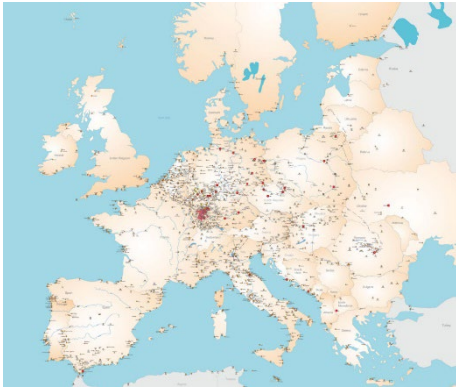
Fig. 1- Festungskarte Europa.

Tale ambizioso programma prevedeva l'individuazione di un modello di governance e la costituzione di una task force "dedicata" alla costruzione di leve finanziarie per la gestione sul breve e lungo periodo, grazie all'avvio di strategie di marketing e di audience development . A tal fine, aveva anche individuato specifici ambiti di interesse in un confronto continuo con istituzioni di prestigio (es. Cabina Unesco).