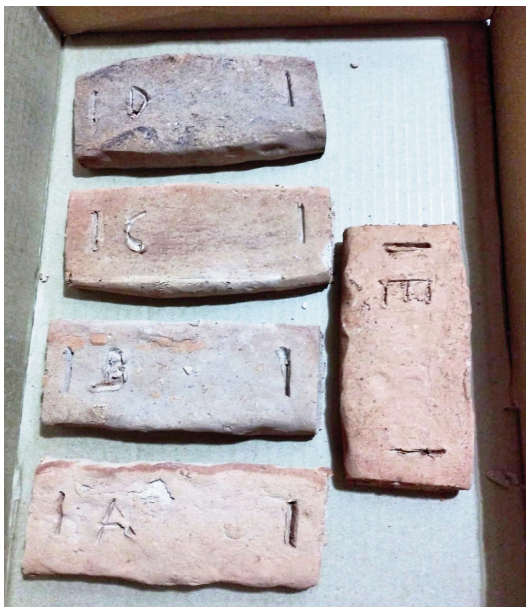
Tab. 2 | Mix-design composition and some properties of samples (credit: the Authors, 2023).

ottimizzare la dimensione delle particelle e le percentuali di sostituzione in aggregati di vetro riciclato anche in funzione dei diversi tipi e colori.