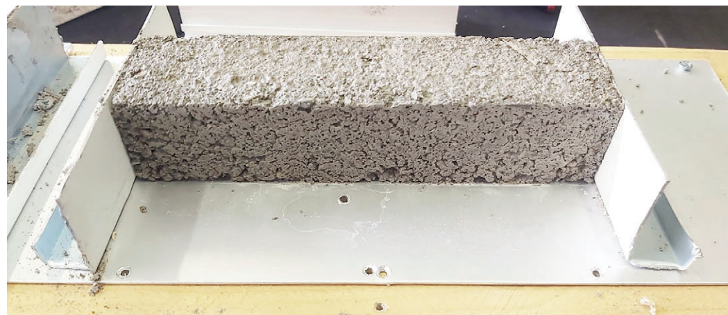
Fig. 3 | Parallelepiped concrete test specimen for screeds (dimensions 4x4x16 cm) with replacement of fine aggregates by recycled glass