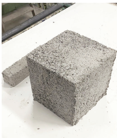
Fig. 4 | Cubic concrete test specimen (15 cm side) with replacement of fine aggregates by the recycled glass (credit: the Authors, 2023).

recycled at the end of their useful life (Munaro and Tavares, 2021). As a result of such instances, the Department of Architecture at the Roma Tre University is conducting a line of research involving two manufacturing companies of environmental product innovation, intercepting the demand for new sustainable and circular models for the management and valorisation of resources. This research line goes towards fostering economies of agglomeration (Lerma and Bruno, 2021), arising out of geographical closeness among stakeholders, to stimulate the transmission of knowledge, know-how and material flows.