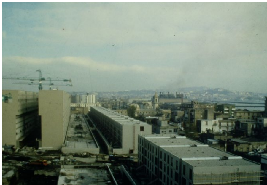
3: Una fotografia aerea del cantiere mostra la fase di montaggio dei moduli prefabbricati, 1975 circa (datazione incerta).