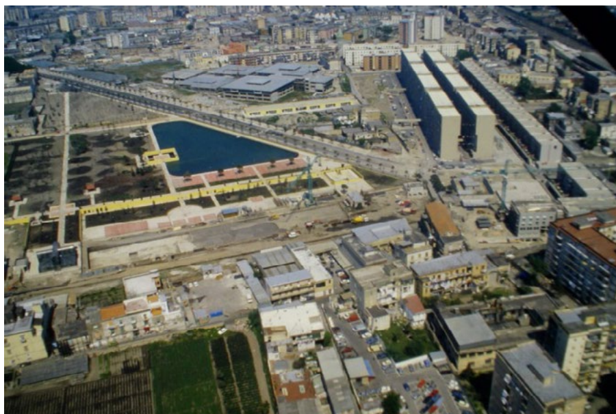
4: Una fotografia aerea del cantiere mostra la fase di realizzazione del parco pubblico che accoglie gli edifici pubblici, le scuole primarie, un giardino all'italiana con serra e lago artificiale, oggi in massima parte vandalizzati e inattivi. A destra, sono visibili i tre volumi residenziali, realizzati a ridosso del tessuto urbano preesistente, 1975 circa (datazione incerta).