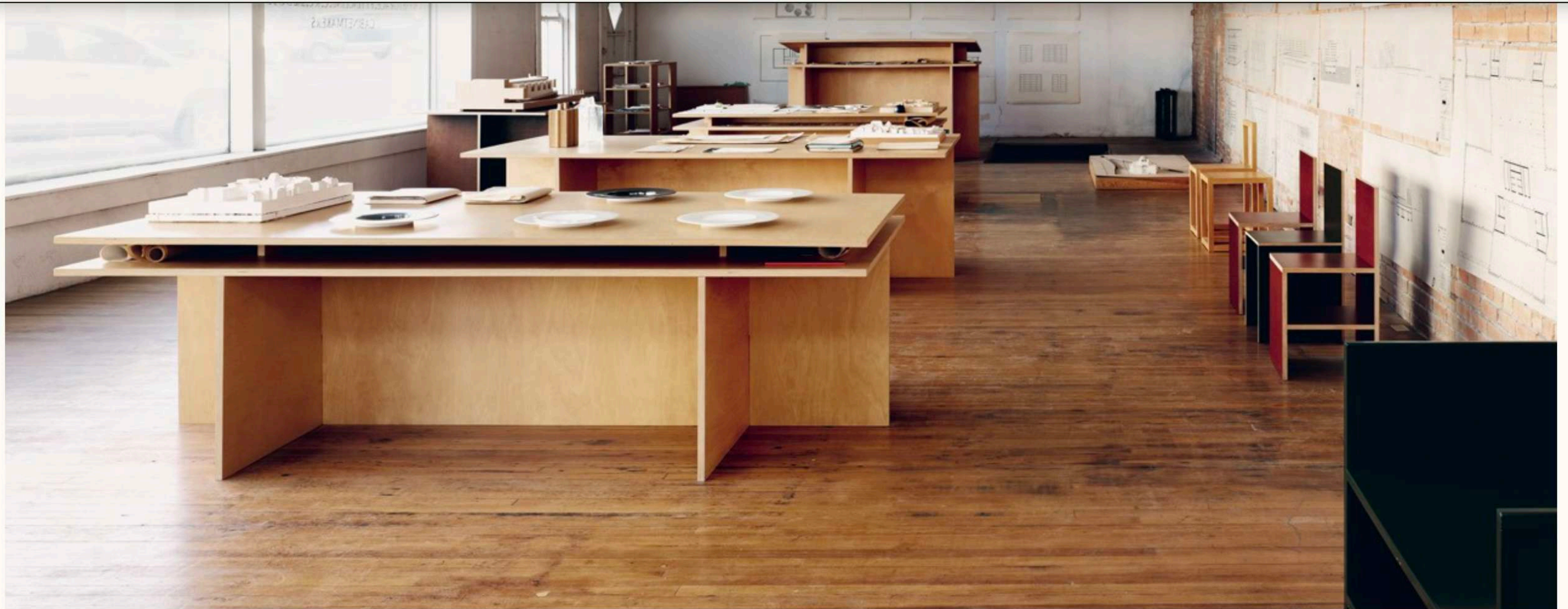
Tavolo di architettura in compensato «Slip Together» presso Architecture Office, Marfa, Texas.