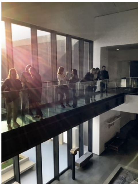
Fig. 1 – Specializzandi e corpo docente in visita al nuovo museo delle sepolture dei sovrani ellenistici, Macedonia, Grecia, ottobre 2019.

crediti, le visite di studio, i cantieri di studi, le conferenze, i seminari e le giornate di studio, confermando un modello che – pur avendo un taglio dichiaratamente professionalizzante – si poneva correttamente all'interno di una formazione di alta specializzazione. I viaggi-studio, infine, supportati per un certo numero di anni da specifici fondi per la mobilità di Ateneo, e in seguito grazie al progetto di eccellenza (2018-2022) del Dipartimento a cui la struttura è amministrativamente appoggiata, hanno rappresentato un elemento forte (e anche per certi versi innovativo) di affiancamento alla didattica più tradizionale, sempre comunque mantenuta a un alto livello e con ricorso a un collegio docenti preminentemente di estrazione politecnica, affiancato, ove necessario, da docenti esterni appositamente coinvolti (per esempio proprio per alcune attività di Atelier ) e affiancato sempre più, nel corso degli anni, da un importante "staff", in larga misura composto da specialisti di anni pregressi che hanno proseguito la loro formazione con l'arruolamento in un dottorato di ricerca e infine, anche, da ormai specialisti-dottori, rimasti affezionati alla struttura e disposti gratuitamente a collaborare.