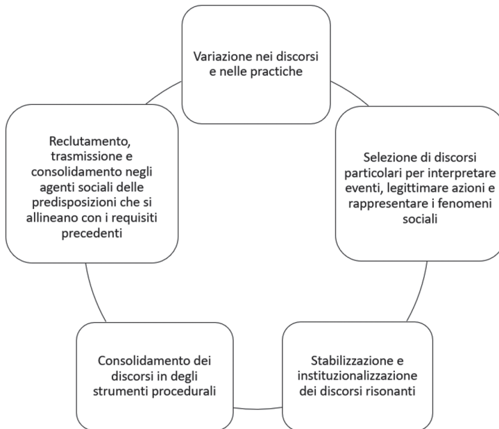
Fig. 1. Il Ciclo Evoluzionista della Cultural Political Economy

Rispetto ad altre forme di analisi economico-politica, la concezione che la CPE ha del potere come fenomeno diffuso e contingente permette di andare oltre l'uso di categorie economiche e politiche reificate e di comprendere come il potere filantropico operi attraverso le diverse scale geografiche e i diversi campi sociali coinvolti dai discorsi e dalle pratiche circondanti la filantropia. Vari casi studio relativi alle pratiche di innovazione sociale hanno dimostrato che, passando dalla scala sovranazionale a quella locale, la distanza tra retorica egemonica e azioni pratiche si allarga, indicando un aumento della complessità dei regimi normativi 58 . Ciò significa che è necessario determinare se e come i precetti associati alla crescente egemonia del modello filantropo-capitalista a livello globale siano applicabili a livello locale. Esistono diversi approcci analitici di politica economica che tornano utili a questo scopo, come le versioni spazializzate della teoria regolazionista e gli approcci d'analisi dei regimi urbani 59 . Questi possono essere combinati per comprendere come le strutture nazionali e sovranazionali, da un lato, e l' agency sociale locale, dall'altro, influenzino la formazione e la riproduzione dei regimi urbani 60 . Tuttavia, nessuno dei due approcci considera il ruolo della produzione discorsiva