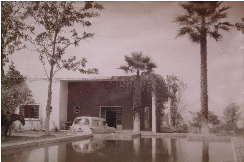
Vicente Nasi. Quinta Jaramillo Arango (1935)