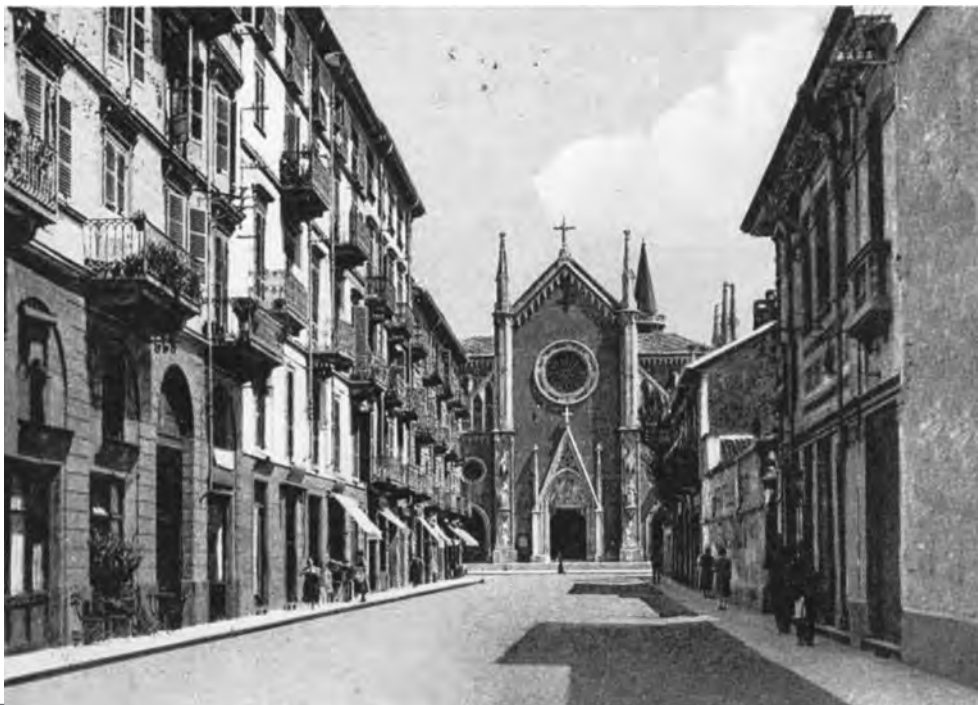
8_La chiesa di Santa Giulia (G. B. Ferrante, 1863).