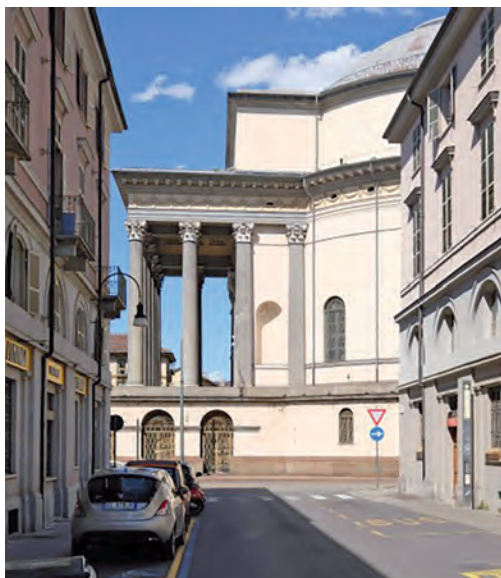
4_Visuale laterale della chiesa della Gran Madre di Dio.

5_Guide locali, voyages pittoresques e periodici illustrati anche stranieri, in questo caso l'americano Frank Leslie's Illustrated Newspaper (1856), non mancano di rilevare la sequenza visiva determinata dall'inedito rapporto tra la piazza Vittorio Emanuele, la nuova chiesa della Gran Madre e il paesaggio retrostante, addirittura enfatizzando in modo quasi caricaturale la presenza della collina.