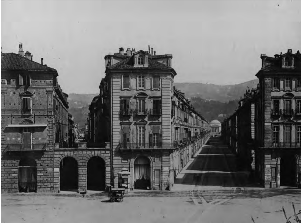
2_ La chiesa della Gran Madre di Dio inquadrata dalla via di Po, in un'immagine del fotografo Henri Le Lieure, circa 1867.