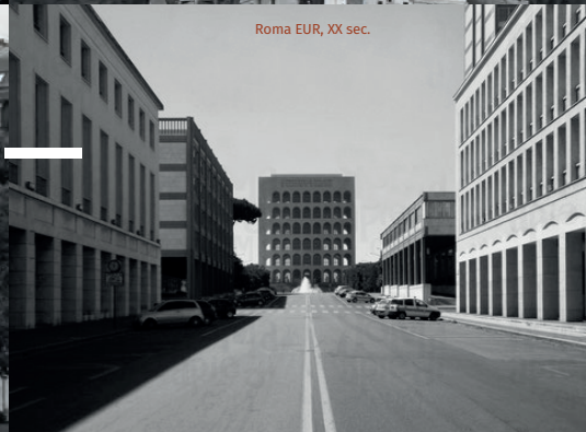
Roma EUR, XX sec.