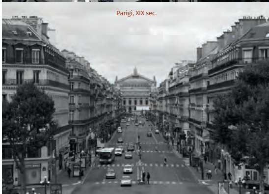
Parigi, XIX sec.