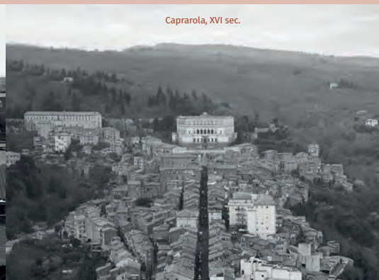
Caprarola, XVI sec.