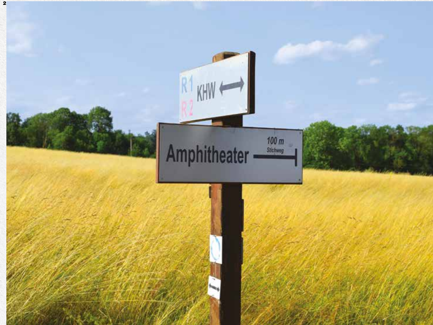
2 Directional signs within the archaeological site of Arnsburg / Indicazioni direzionali all'interno del sito archeologico di Arnsburg. 3 The Arnsburg amphitheater hidden beneath the ground surface / Il sito dell'anfiteatro di Arnsburg celato al di sotto del piano di campagna.