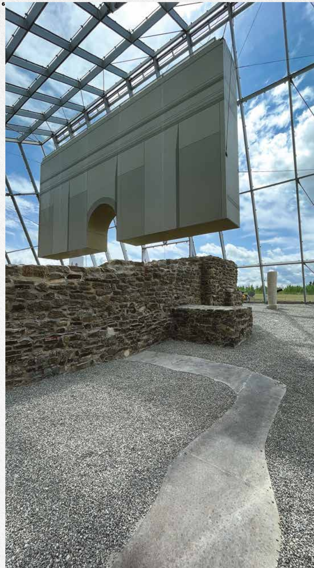
6 Interior perspective of the Limestor, featuring an installation that evokes the original architectural volume / Vista interna della Limestor e dell'installazione che evoca il volume architettonico originario.