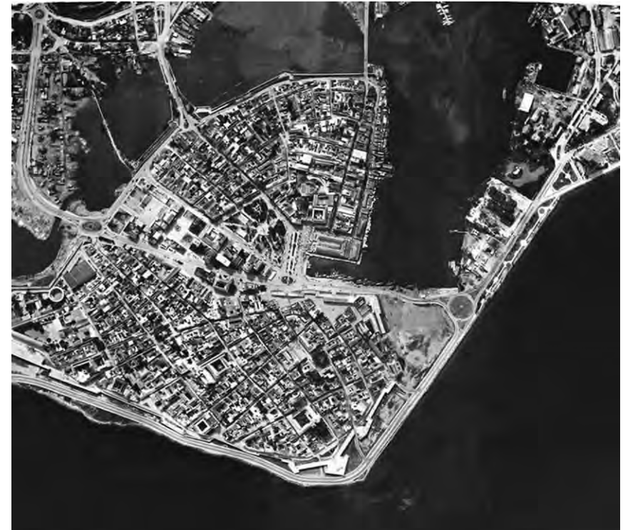
Cartagena de Indias, foto aerea 1950

L'impresa fortificatoria mette in moto un avanzamento tecnico, teorico e professionale e innesca la circolazione di idee e di professionisti, causando effetti determinanti sulla costruzione della città, sulla rappresentazione cartografica, sull'architettura. I detentori di questa pluralità di saperi, gli ingegneri militari, sono impegnati in sopralluoghi, perizie, rilievi e progetti stilando molti disegni: l'immagine tramandata della città tra '400 e '600 passa, anche ma non solo, attraverso i loro occhi e la loro mano. "L'ingegnere [...] non è un funzionario ma un matematico e un artista che possiede ed esercita l'arte di pensare la guerra sul terreno concreto; egli possiede anche la capacità di muoversi sul territorio e non lavora quasi mai a tavolino. È di regola anche comandante militare, maître di truppe e soldati, governatore o intendente di specifiche piazzeforti" 49 . Nei disegni degli ingegneri militari la città è spesso rappresentata nella sua totalità (di perimetro, ma con non poche omissioni, quali ad esempio l'ordito del