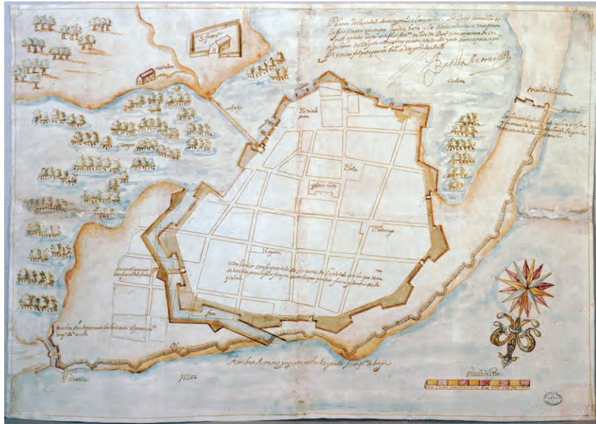
Bautista Antonelli, "Planta de la Ciudad de Cartagena de Yndias y sus fortificaciones, manifestándose por líneas amarillas la fortificación ó cerca que se podrá..." 18 de Abril /de 1594/.

L'impresa fortificatoria mette in moto un avanzamento tecnico, teorico e professionale e innesca la circolazione di idee e di professionisti, causando effetti determinanti sulla costruzione della città, sulla rappresentazione cartografica, sull'architettura. I detentori di questa pluralità di saperi, gli ingegneri militari, sono impegnati in sopralluoghi, perizie, rilievi e progetti stilando molti disegni: l'immagine tramandata della città tra '400 e '600 passa, anche ma non solo, attraverso i loro occhi e la loro mano. "L'ingegnere [...] non è un funzionario ma un matematico e un artista che possiede ed esercita l'arte di pensare la guerra sul terreno concreto; egli possiede anche la capacità di muoversi sul territorio e non lavora quasi mai a tavolino. È di regola anche comandante militare, maître di truppe e soldati, governatore o intendente di specifiche piazzeforti" 49 . Nei disegni degli ingegneri militari la città è spesso rappresentata nella sua totalità (di perimetro, ma con non poche omissioni, quali ad esempio l'ordito del