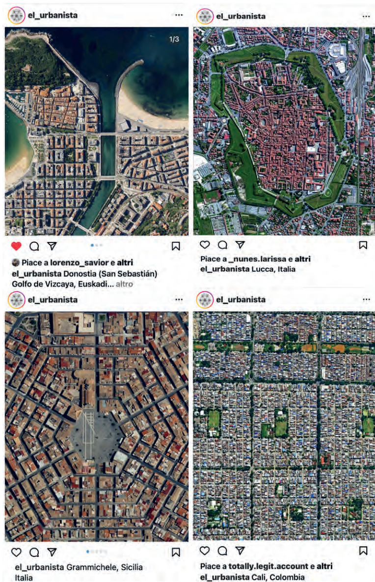
L'account Instagram @el_urbanista pubblica periodicamente vedute aeree di città in cui sono evidenti le cicatrici della loro storia.