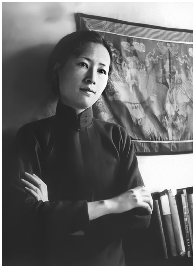
1: Ritratto di Lin Huiyin nel 1935 (pubblico dominio, pubblicato in ZI Y. 紫云英, 2014).