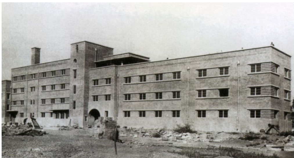
3: I Dormitori Femminili dell'Università di Pechino (1935), progetto di Lin Huiyin e Liang Sicheng (pubblico dominio, pubblicato in Denison, Ren, 2008).