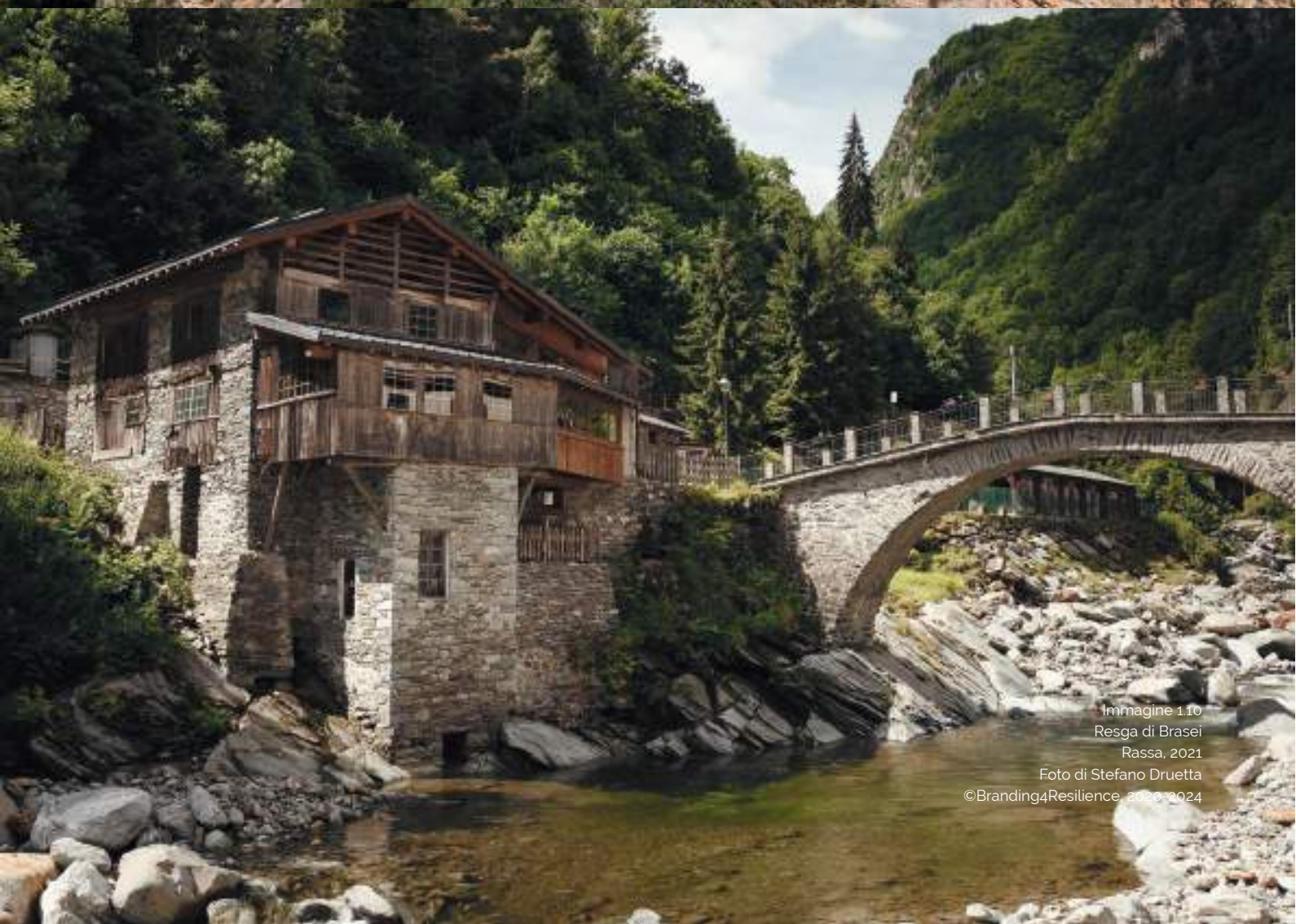
Immagine 1.10 Resga di Brasei Rassa, 2021