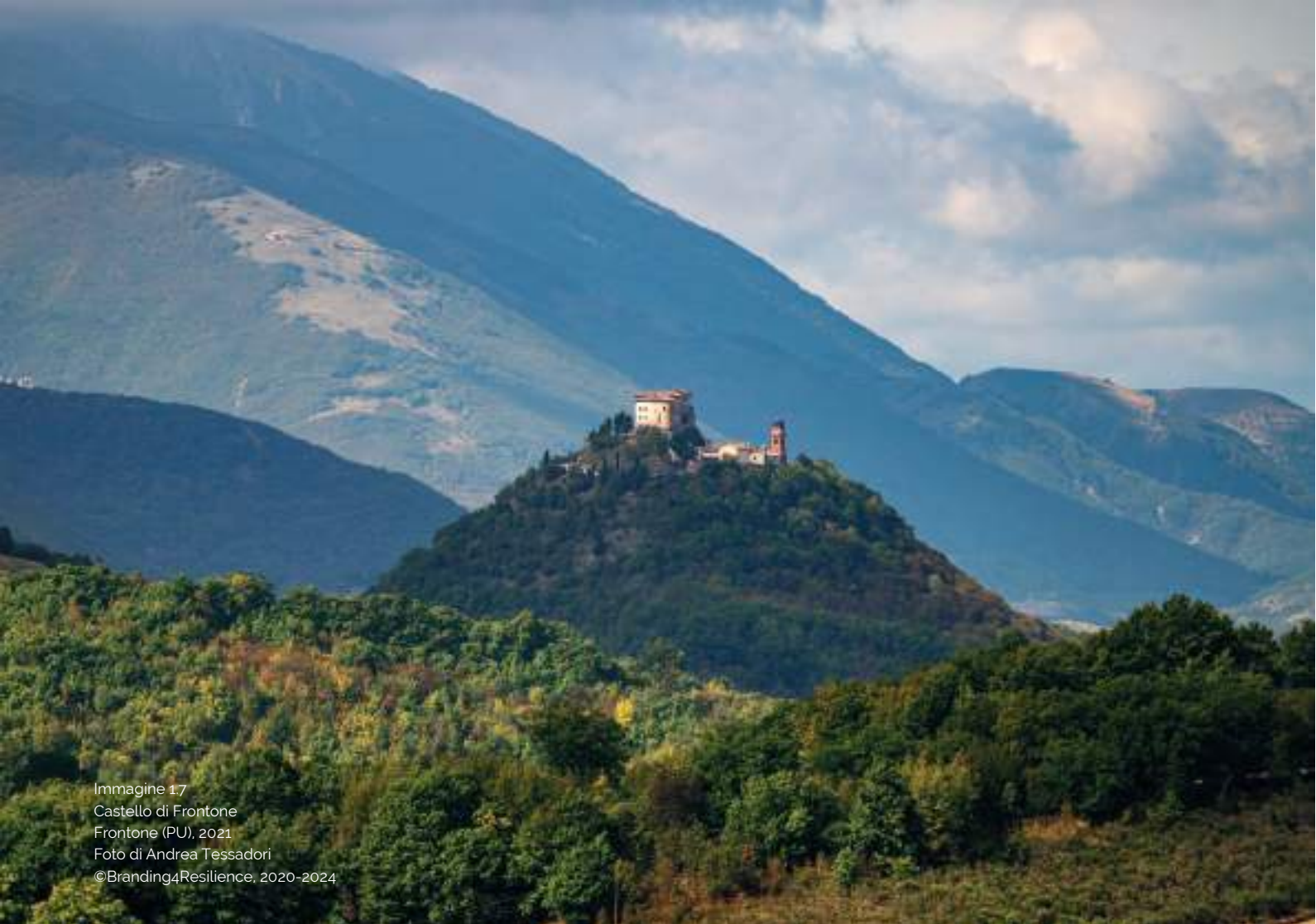
Immagine 17 Castello di Frontone Frontone (PU), 2021