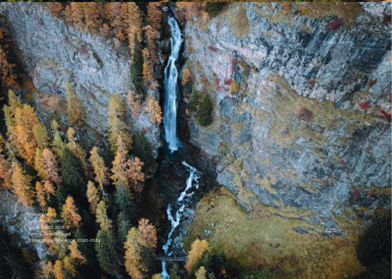
Immagine 19 Cascate di Saent Val di Rabbi, 2021