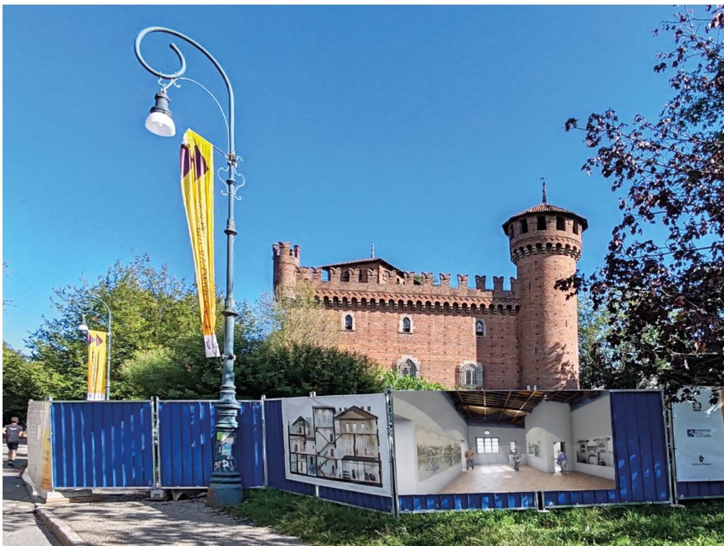
Fig. 2 – Il cantiere di restauro che sta coinvolgendo il Borgo dagli inizi del 2024. In particolare, transenne intorno alla Rocca, con l'illustrazione dei render di progetto (a sinistra, la sezione prospettica dei fabbricati attorno al Cortile di Avigliana mentre, a destra, una vista prospettica della Casa di Pinerolo).