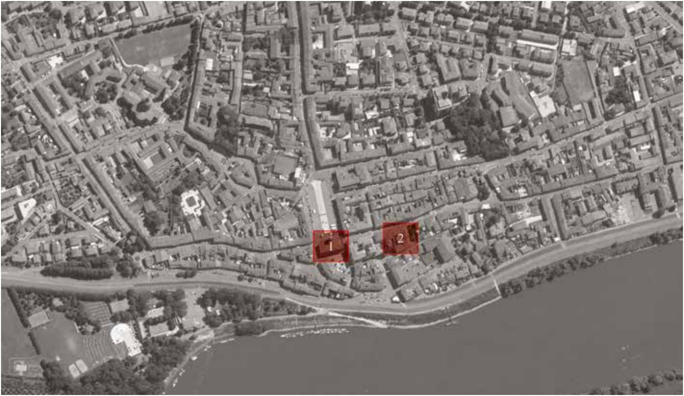
2. Casalmaggiore. Localizzazione dell'attuale palazzo comunale (n. 1) e del vecchio palazzo pubblico e antico teatro (n. 2).

La soluzione di Voghera, presentata intorno al 1829, manteneva l'impostazione planimetrica di Mones 6 . Per la facciata sulla piazza principale, il progettista proponeva due soluzioni: la più articolata [Fig. 3] era suddivisa in tre parti, di cui quella centrale era caratterizzata da quattro colonne di ordine corinzio gigante, mentre le terminazioni laterali presentavano lesene del medesimo tipo. Una ricca trabeazione coronava l'intero edificio e al centro era sormontata dal frontone e da un attico, che facevano da base alla torre campanaria, impostata su una pianta ottagonale. L'intera facciata era arricchita da sculture che rappresentavano i simboli dell'amministrazione civica e quelli di Casalmaggiore.