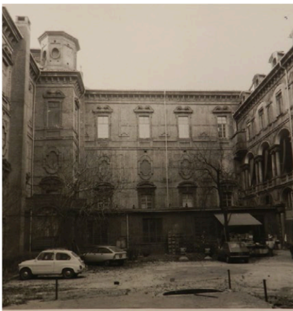
Figura 1. Torino, ex Antico Ospedale di San Giovanni, stato di fatto del cortile retrostante la manica principale.