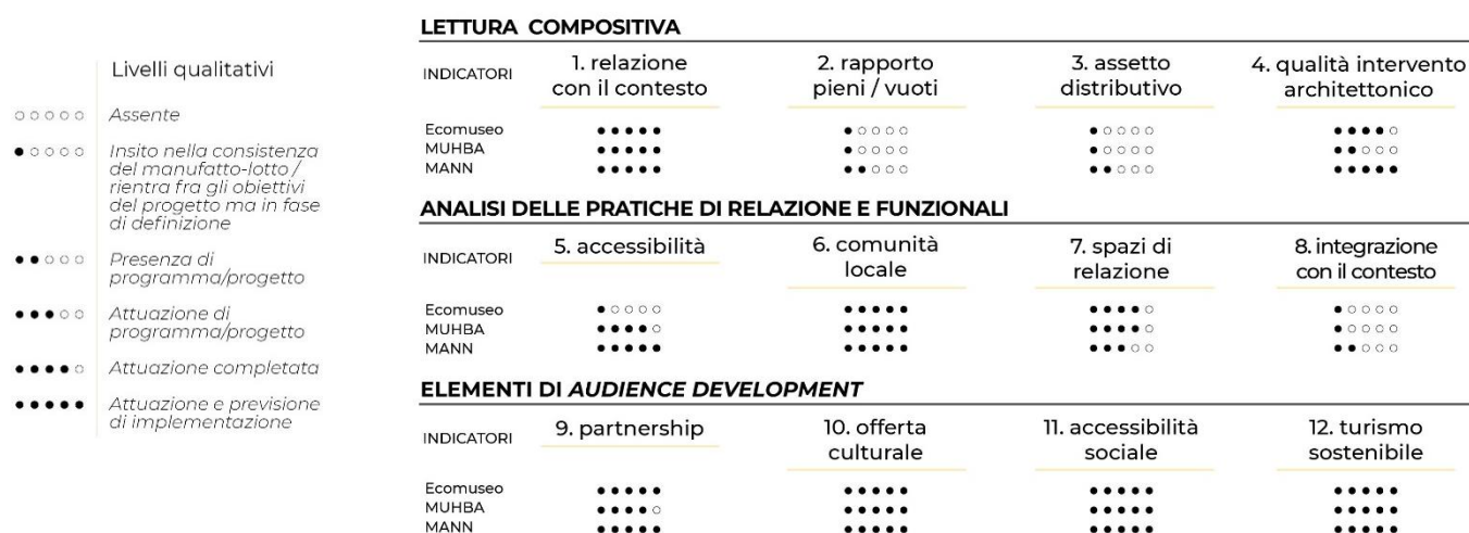
Figura 9. La dashboard cross-analysis: indicatori e rating scale