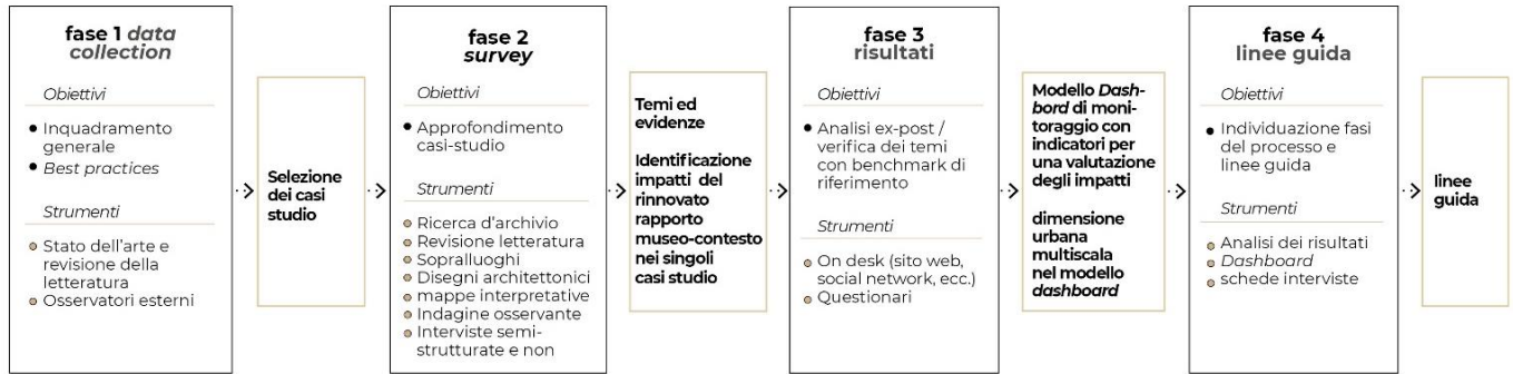
Figura 1. Design di ricerca