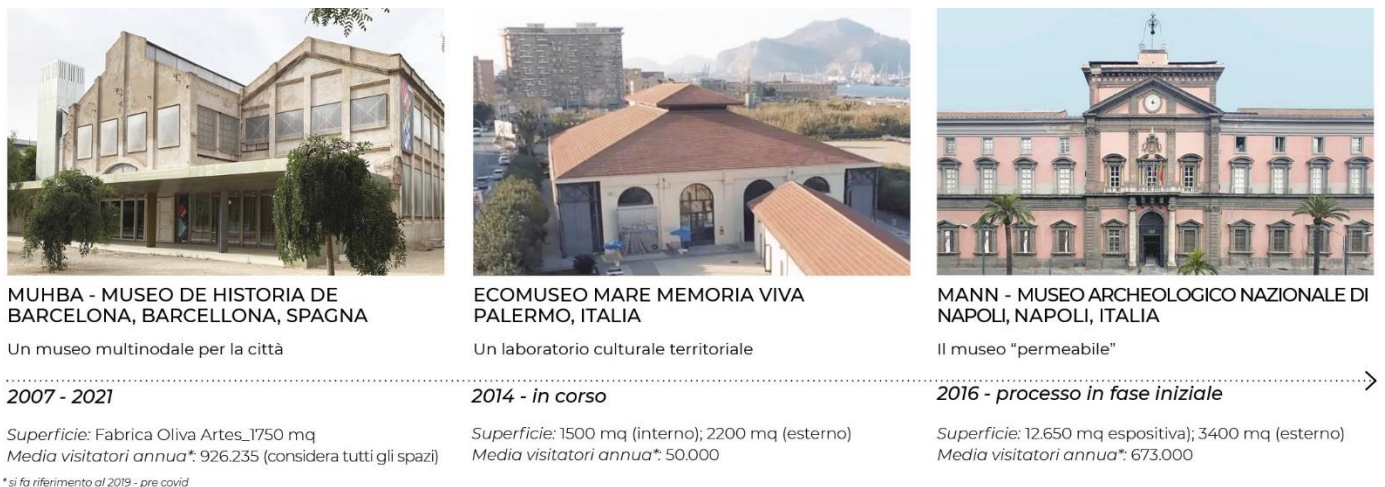
Figura 4. I tre casi studio selezionati e le fasi del processo di trasformazione

attuali competenze progettuali ai nuovi bisogni e al nuovo ruolo dell'istituzione museale nei processi di trasformazione urbana.