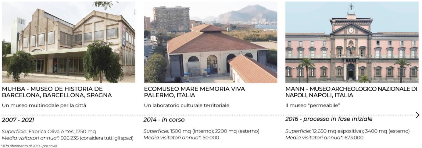
Figura 4. I tre casi studio selezionati e le fasi del processo di trasformazione

attuali competenze progettuali ai nuovi bisogni e al nuovo ruolo dell'istituzione museale nei processi di trasformazione urbana.