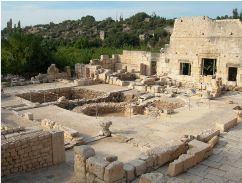
Fig. 3. Mersin (Turchia), Elaiussa Sebaste, l'agorà dopo gli interventi. Il progetto di fruizione ha tenuto conto delle esigenze conservative della pavimentazione, che è stata globalmente restaurata. Il percorso dà modo di evidenziare le diverse stratificazioni, come le fondazioni della tholos al centro, di cui gli elementi architettonici in elevato furono reimpiegati per la costruzione delle absidi contrapposte della basilica protobizantina (foto Missione Archeologica Italiana 2007).