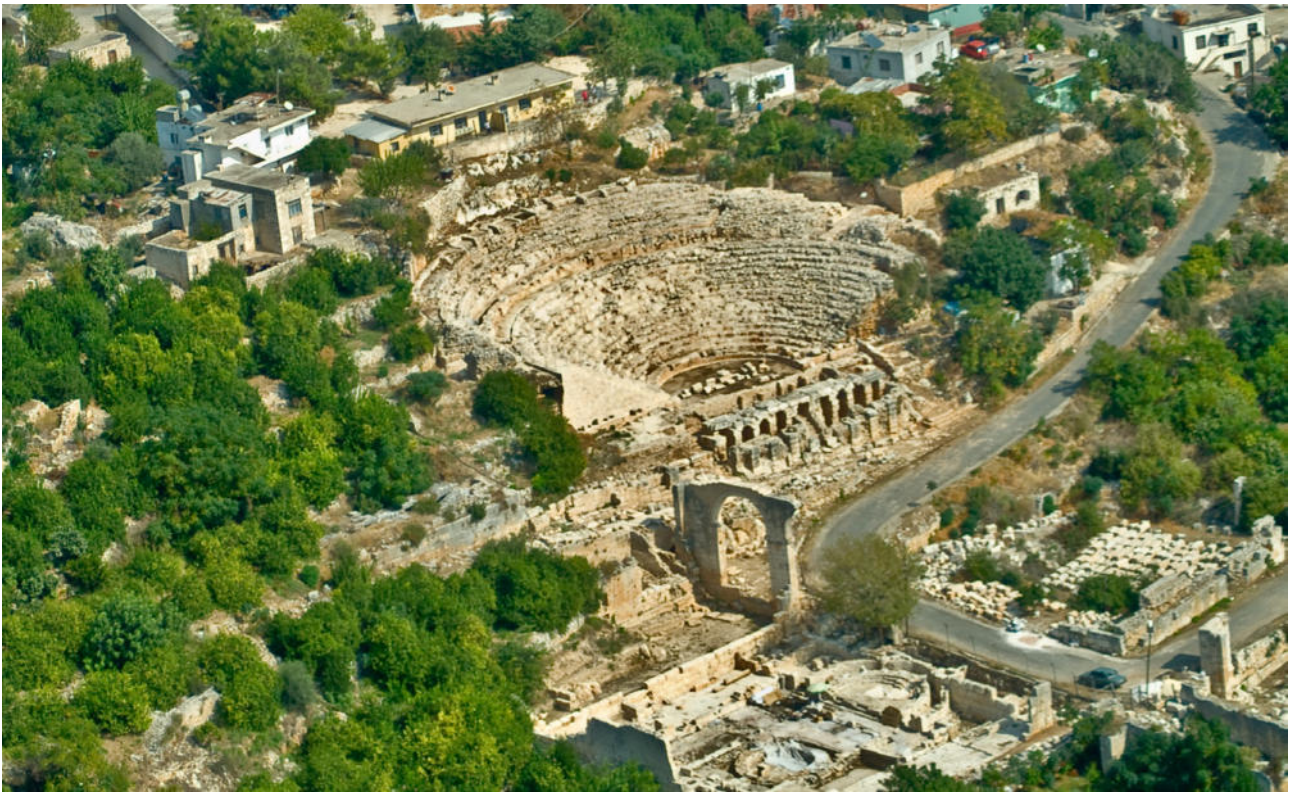
Fig. 2. Mersin (Turchia) Elaiussa Sebaste, veduta aerea di una porzione dell'area archeologica litoranea. In primo piano, l'agorà e il teatro, attornati dal contesto urbano e dalle coltivazioni autoctone che sottolineano la continuità d'uso dell'insediamento.

edifici e infrastrutture territoriali 7 . Tale approccio olistico alla conoscenza ha consentito di individuare e catalogare i frammenti erratici, derivanti dalla distruzione del patrimonio pagano; di ricostruire le fasi medievali grazie alla lettura degli spolia presenti (soprattutto nell'agorà); di determinare le modificazioni d'uso avvenute sia presso il teatro e il Palazzo bizantino, sia presso l'estesa area della necropoli; di evidenziare lo stato di conservazione di strutture e materiali, analizzandone i dissesti e il degrado (Fig. 2). A questo si è aggiunta un'analisi territoriale dei problemi sociali ed economici che affliggono il territorio: dall'uso improprio di monumenti, all'abbandono dei siti archeologici; dallo sfruttamento dei paesaggi all'inadeguatezza della legislazione turca di arginare abusi e speculazioni edilizie, non incentivando le produzioni artigianali e le colture autoctone 8 .