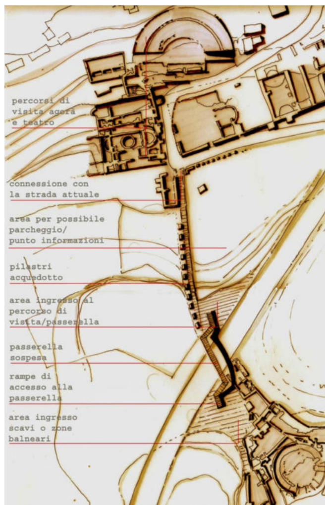
Fig. 1. Mersin (Turchia), Elaiussa Sebaste, masterplan con proposta di collegamento tra le due aree del sito archeologico, divise dalla presenza della strada costiera (elab. A. Re 2005).