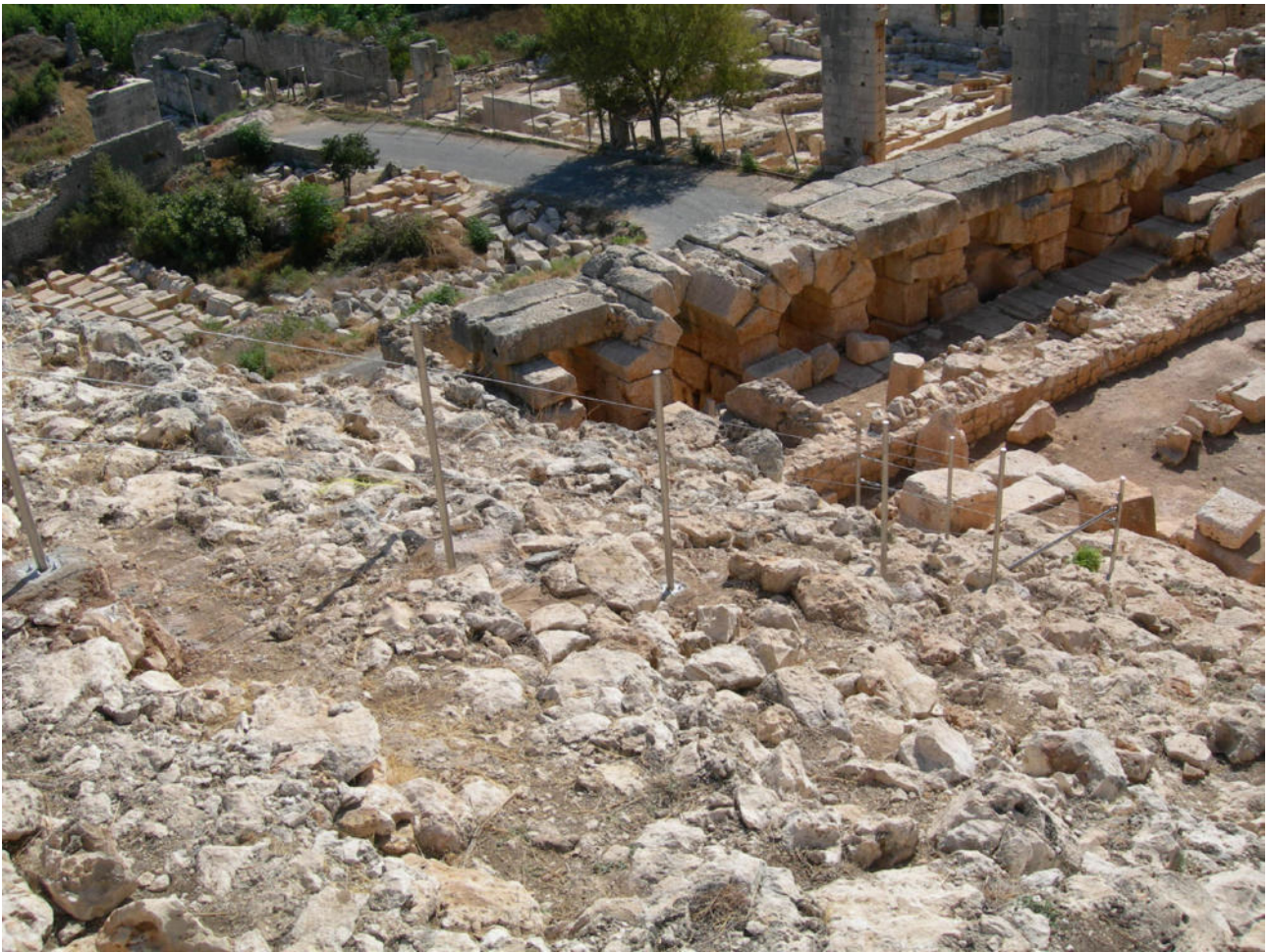
Fig. 5. Mersin (Turchia), Elaiussa Sebaste, particolare dell'intervento riguardante la cavea del teatro. Il sistema di recinzione in tubolari e cavi d'acciaio impedisce l'accesso alle aree non ancora messe in sicurezza, garantendo l'incolumità dei visitatori, e delimita lo spazio visitabile del monumento escludendo provvisoriamente le porzioni ancora oggetto di scavo. Il sistema modulare consente di modificare il percorso sulla base della progressione dei lavori.