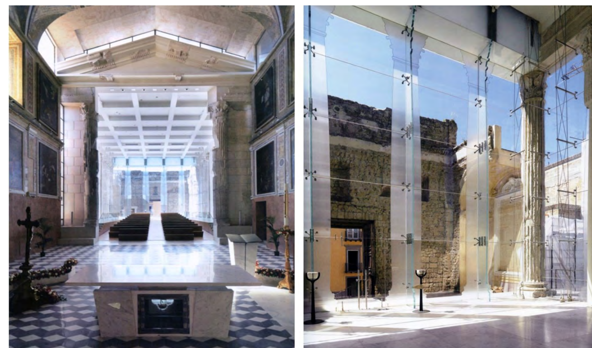
Fig. 5, 6 - Pozzuoli, il restauro del Tempio-Duomo in cui l'apporto progettuale, evoca le antiche parti mancanti del tempio, garantendo l'uso museale e religioso del monumento.