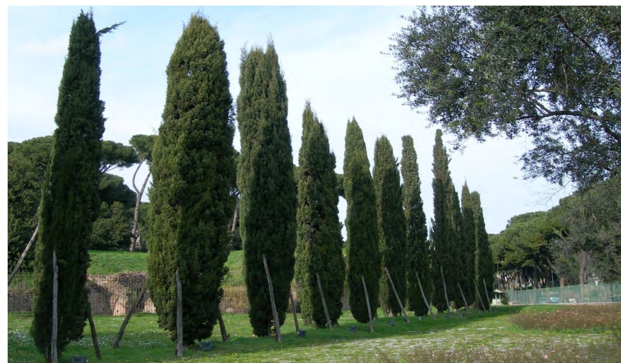
Fig. 7 - Roma, la 'riproposizione' del Septizodium con un filare di cipressi, evoca la posizione dell'antico ninfeo, abbandonando la strada delle più invasive ricostruzioni.