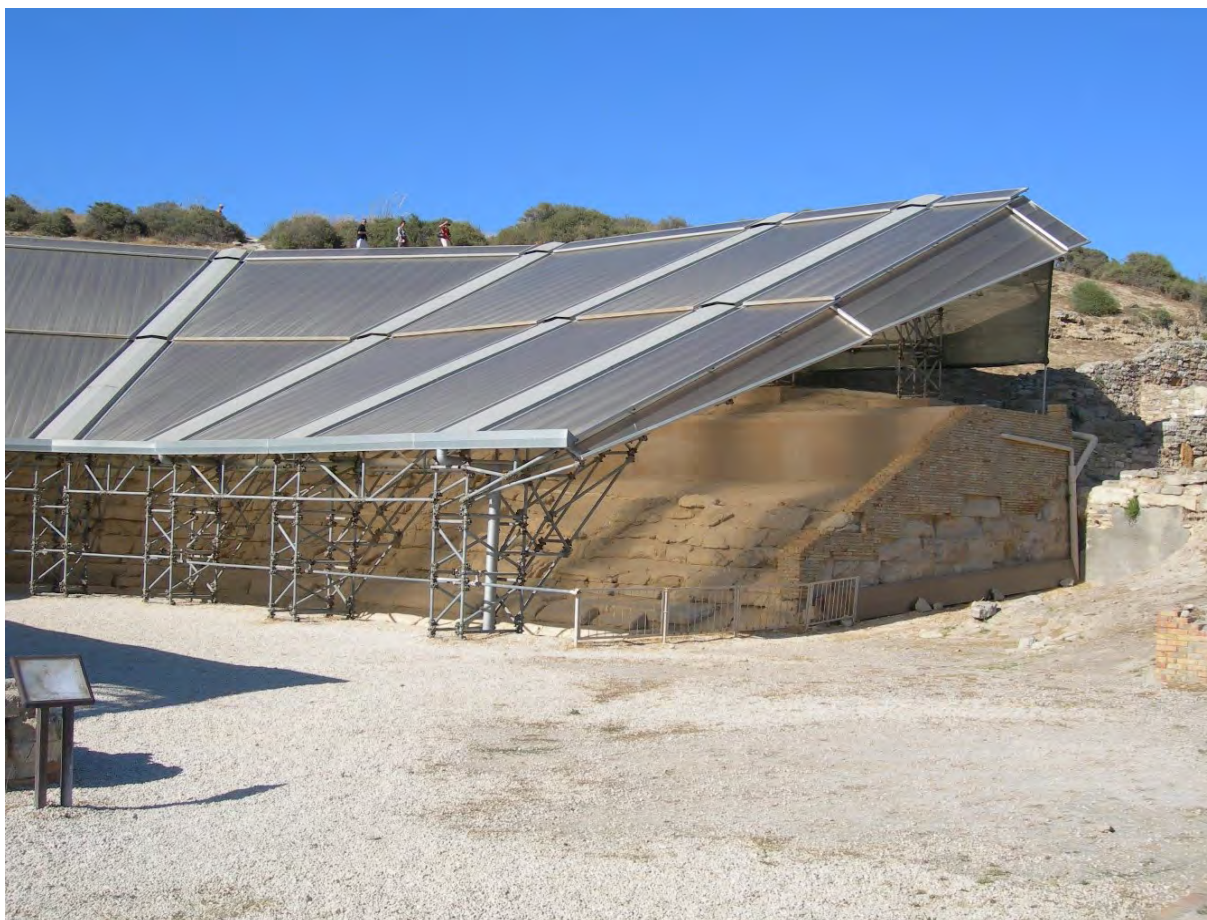
Fig. 3 - Eraclea Minoa, veduta dell'attuale copertura del teatro. Sono evidenti le soluzioni di restauro poco attente al valore materico del monumento.

te si può quindi affermare che, in mancanza di una totale reversibilità, l'unica azione a garanzia della conservazione del patrimonio archeologico sia la manutenzione, purtroppo carente in quasi tutti i paesi europei e del bacino mediterraneo. Con molta probabilità una più attenta manutenzione costante avrebbe evitato l'irreversibile l'obsolescenza delle soluzioni progettuali minissiane per tutti i siti archeologici siciliani. Analogamente per quanto riguarda un altro aspetto centrale del restauro archeologico, come la distinguibilità, spesso non garantita, se si analizzano le massicce integrazioni nel teatro grande di Pompei. In quest'ultimo caso il precoce invecchiamento dei materiali impiegati, rende ancor più arduo distinguere i frammenti originali da quelli di più recente integrazione, oltre al fatto che del teatro antico è rimasto ben poco (fig.4). Merita invece di essere segnalato, come esempio positivo, il restauro del Tempio-Duomo di Pozzuoli, opera di Marco Dezzi-Bardeschi [9] in cui sono state conservate tutte le successive stratificazioni: l'approccio è corretto ed evidenzia gli apporti contemporanei rispetto agli elementi originali di cui si esalta l'autenticità (figg. 5, 6).