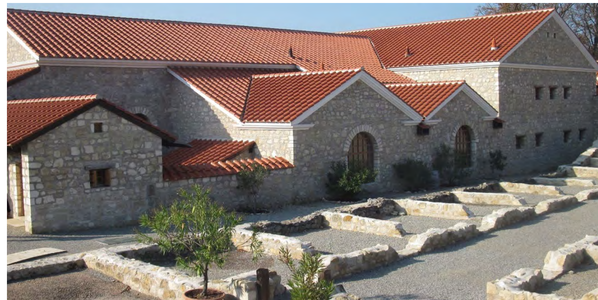
Fig. 8 - Carnuntum, il ripristino, a fini didattici, per far comprendere meglio le rovine, ricostruendo intere abitazioni che incombono sui pochi autentici lacerti romani (foto E. Romeo 2007).

Giudicando, però, positivamente la presentazione al pubblico degli elementi superstiti della Schola Armaturarum, l'attenta conservazione di alcune domus a Pompei, tra cui il progetto di restauro e apertura