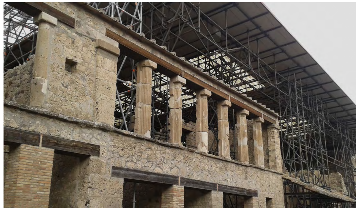
Fig. 10, 11 - In alto, Pompei, gli allestimenti didattici all'ingresso della Schola Armaturarum, sostituiscono, in parte la visita del monumento, in attesa del suo intervento di consolidamento e restauro. In basso, Pompei, il progetto di protezione della Casa dei Casti Amanti consente la parziale apertura al pubblico del monumento. Il coinvolgimento diretto dei visitatori, ha attuato la pratica della 'live restoration', come progetto compatibile di conservazione del patrimonio archeologico. Foto E. Romeo 2016.

possa adeguare le proprie leggi di tutela comprendendo, nelle indicazioni in esse contenute, non solo gli approcci metodologici ma anche indicazioni operative che consentano di applicare quelle 'buone pratiche' indispensabili affinché si raggiungano esiti sempre più condivisi dalle comunità scientifiche di riferimento.