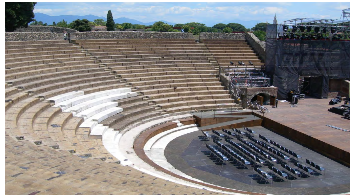
Fig. 4 - Pompei, l'intervento di completamento della cavea e dell'orchestra, nasconde le originali strutture del teatro, impedendo la visione della pedana scenica superstiti.

stra come possa essere interessante intraprendere tale strada, abbandonando più invasive ricostruzioni (fig. 7). Questo ricorda, invece, quanto sia ancora valido il concetto di minimo intervento e quanto esso sia sempre meno rispettato soprattutto nelle azioni di valorizzazione; quelle rivolte al massimo sfruttamento del patrimonio archeologico (si pensi solo alle proposte di copertura dell'anfiteatro di Verona o alla pavimentazione dell'arena del Colosseo) attraverso incompatibilità tra usi attuali e autenticità materico-formale della rovina. La necessità, quindi, di segnalare gli esempi di beni archeologici a rischio o completamente compromessi sia per l'effetto di sconsiderati interventi di restauro sia per gli esiti di valorizzazioni che hanno 'giustificato' l'uso, a volte anche invasivo, della rovina per garantire un flusso