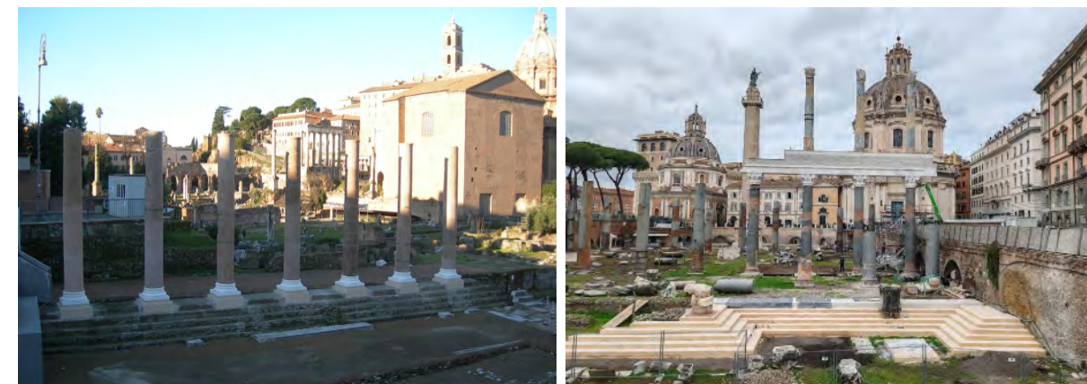
Figg. 1, 2 - A sinistra, Roma, l'intervento di anastilosi di alcune colonne del portico del Forum Pacis, terminato nel 2015. Alla ricomposizione non si accompagnano, però, adeguati strumenti di informazione; a destra, Roma, il recente intervento di ricomposizione di alcune parti smembrate della Basilica Ulpia. Il progetto mostra un'interpretazione poco condivisibile della valorizzazione.

E queste due esperienze siciliane portano, inoltre, a chiedersi se gli interventi presso la Villa del Casale di Piazza Armerina siano realisticamente più reversibili rispetto ai precedenti. Sicuramente in questo caso si potrebbe rimpiangere di non aver usato strumenti virtuali di evocazione della memoria meno invasivi (si pensi al cassettonato ligneo della sala absidata) o si potrebbero ricordare con nostalgia le aggiunte di Minissi, maggiormente distinguibili, rispetto agli elementi di imitazione formale e stilistica (travi lignee, elementi lapidei, manti di copertura) delle attuali soluzioni restaurative. Ragionevolmen-