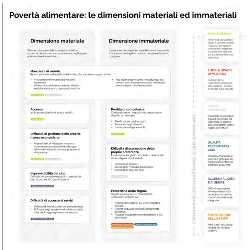
FIG. 2. Povertà Alimentare: le dimensioni materiali ed immateriali emerse dalle attività di field and desk research.

l'obesità, il diabete e le malattie cardiache (Long et al., 2020). La sfera immateriale riguarda invece gli aspetti emotivi, relazionali e di autonomia, legati al modo in cui si vive l'atto del mangiare: le situazioni e i luoghi di consumo, la convivialità, la possibilità di scegliere quando, cosa e come mangiare, le conoscenze e le competenze per l'acquisto e la preparazione del cibo. A partire da tale scenario è stato scelto di affrontare il fenomeno adottando un approccio multidimensionale e sistemico (Bistagnino, 2011), co-progettando con gli attori coinvolti delle nuove strategie in grado di affrontare la complessità del fenomeno.