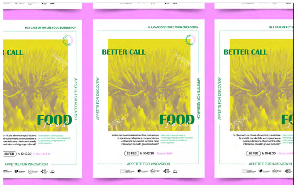
FIG. 2. Locandina di invito per le sperimentazioni.

Il gruppo di partecipanti sarà impegnato in un rituale di 45 minuti. Le attività sono pensate per far familiarizzare i partecipanti occidentali con questo nuovo regime alimentare, enfatizzando simboli, gesti e atti emotivamente risonanti che evocano curiosità e apertura, permettendo loro di considerarne le implicazioni nella cultura occidentale.