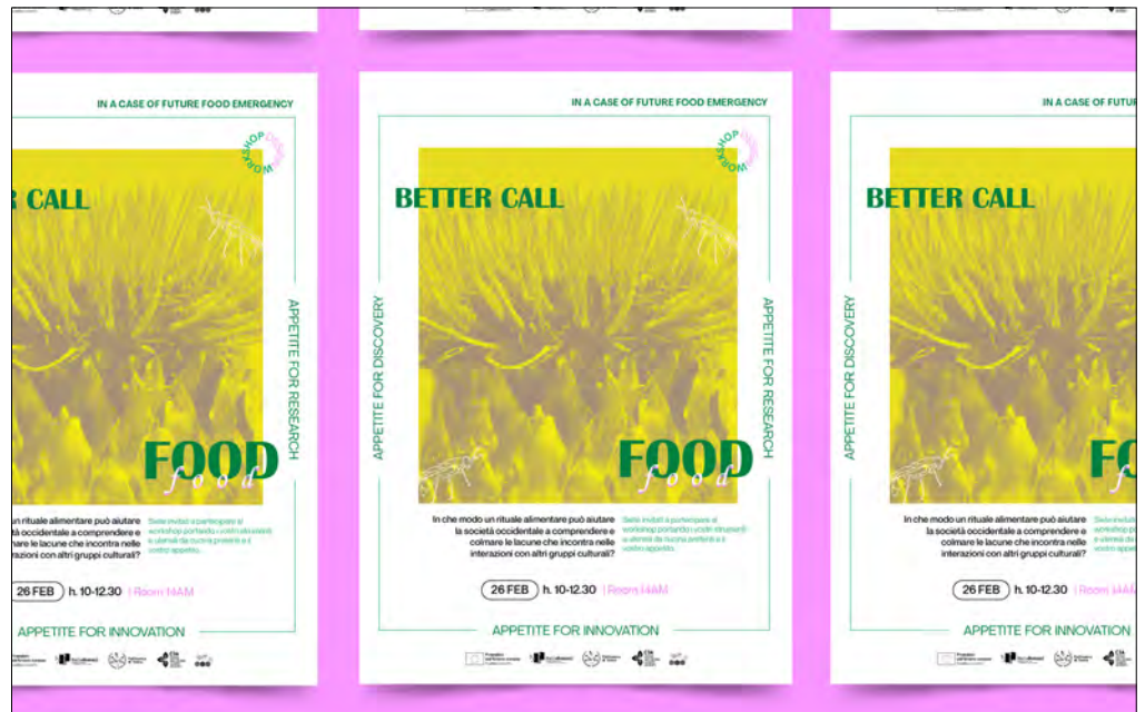
FIG. 2. Locandina di invito per le sperimentazioni.

Il gruppo di partecipanti sarà impegnato in un rituale di 45 minuti. Le attività sono pensate per far familiarizzare i partecipanti occidentali con questo nuovo regime alimentare, enfatizzando simboli, gesti e atti emotivamente risonanti che evocano curiosità e apertura, permettendo loro di considerarne le implicazioni nella cultura occidentale.