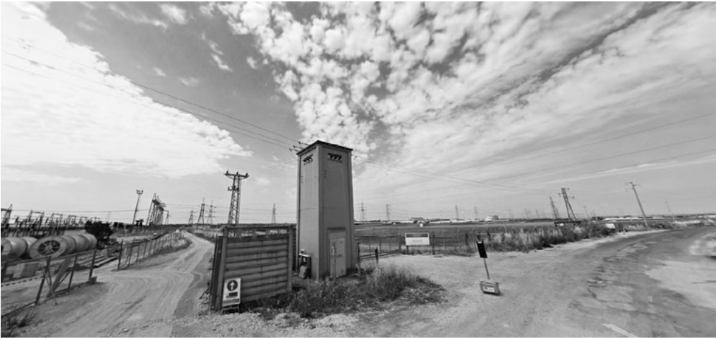
3: Esempio di paesaggio fotovoltaico. La fotografia è stata scattata sulla strada che circonda il perimetro della centrale fotovoltaica a Montalto di Castro. L'impatto visivo negativo è dato dai dispositivi "accessori" all'impianto come cabine, tralicci, recinzioni, di scarsa qualità e disposti in modo quasi "accidentale".

esempio il caso di Troia, in provincia di Foggia. Il secondo modello è, all'opposto, frammentato. Un esempio di questo secondo tipo è l'impianto nel comune di Montalto di Castro, in provincia di Viterbo, in cui l'attuale estensione si è determinata per mezzo della sommatoria di una serie di ampliamenti che si sono succeduti nel tempo in base alle opportunità offerte. Qui, dal centro storico del paese arroccato su un'altura, si osserva la campagna circostante ricorrentemente interrotta dalla presenza di filari di pannelli fotovoltaici, nonché attraversata da numerosi cavi sospesi su tralicci di differenti forme e dimensioni.