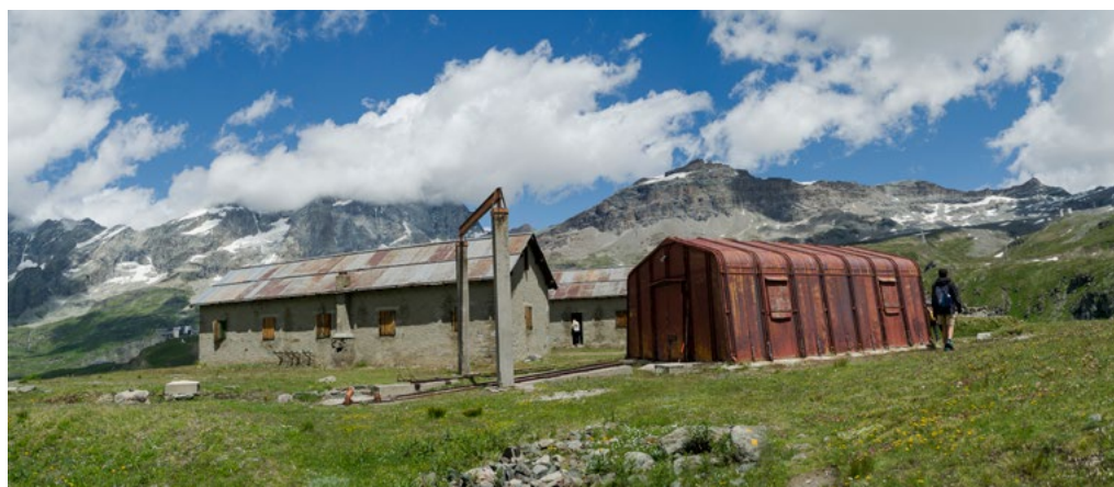
1: Alcune infrastrutture realizzate per la costruzione della diga del Goillet e solo parzialmente rimosse.

Impianti di questo tipo sono a noi familiari perché, come afferma Rosario Pavia [1994], non esiste valle, delle Alpi o degli Appennini, in cui questo vasto processo di captazione non abbia avuto luogo. Solo la tragedia del Vajont del 1963, con i suoi 1.917 morti, fece tramare questo processo di colonizzazione di torrenti e fiumi arrestando definitivamente il progredire del grande idroelettrico in Italia.