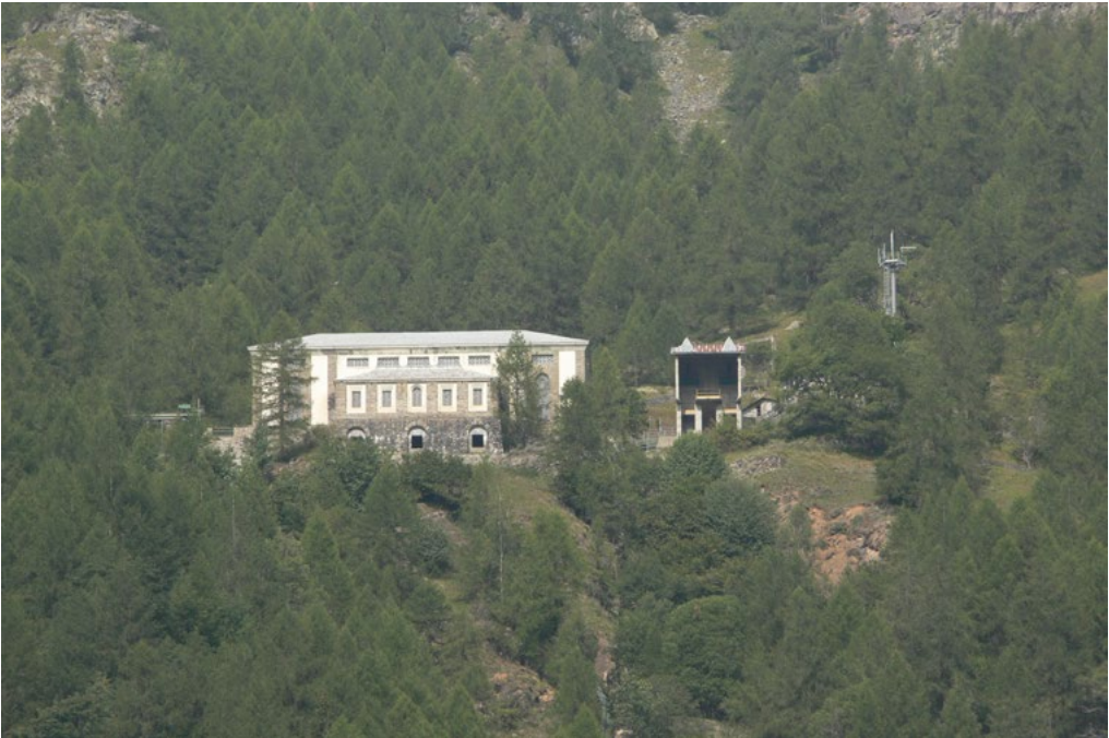
2: Stazione di pompaggio di Promeron collocata tra le dighe di Cignana e la centrale di Maen. Il sistema di Cignana è realizzato dall'impresa Breda che commissiona i progetti della centrale e della stazione all'ingegner Giovanni Muzio che, in Valtournenche, è anche autore delle centrali idroelettriche di Covalou, anch'essa ad accumulo, e di Perrères.

Se si osservano i dispositivi necessari per la produzione di energia idroelettrica, per lo più realizzati tra la fine dell'Ottocento e la prima metà del Novecento, si notano almeno tre aspetti peculiari che rendono significativo il loro impatto paesistico. In primo luogo, si tratta di dispositivi che hanno trasformato radicalmente paesaggi naturali in un periodo storico in cui la fiducia nel progresso era indiscussa. Secondo, hanno trasformato non solo l'immagine ma anche le culture di vasti territori – i fiumi hanno smesso di essere solo luoghi di pesca e i monti hanno smesso di essere solo luoghi di transumanza. Per ultimo, la loro impronta, anche se addolcita dal tempo e dalla natura che ne ha ammorbidito le spigolosità, è irreversibile.