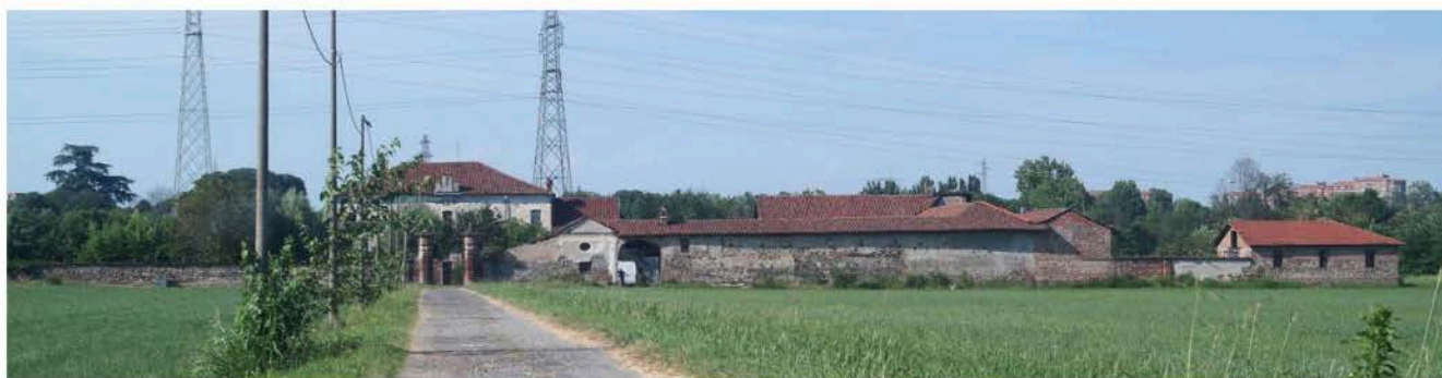
2: Cascina il Mineur, uno dei casi più esemplificativi di complesso rurale risparmiato dai fenomeni di ingrandimento della città, in una foto che rivela la sua convivenza con i più recenti elettrodotti.

La conduzione di un così vasto territorio messo a reddito, era garantita tutto l'anno da una popolazione di coltivatori legati da contratti rurali (fittavoli, mezzadri ed enfiteuti, in genere con contratti di locazione di nove anni 13 ), di fattori, che prendevano in gestione la cascina e i suoi annessi dalla proprietà (per lo più in capo ad aristocratici o a istituti religiosi), a cui si affiancavano i piccoli proprietari degli appezzamenti agricoli, già copiosi nel Settecento, ma particolarmente accresciuti nel secolo seguente in forza di un diffuso processo di frazionamento delle proprietà fondiari, poi venuti a costituire una moltitudine di diretti coltivatori dei fondi, sicché «queste provincie, da poche in fuori, sono di proprietà molto divisa, cioè con le grandi tenute son poche, numerosissimi i poderetti coltivati dalla mano medesima del proprietario» 14 .