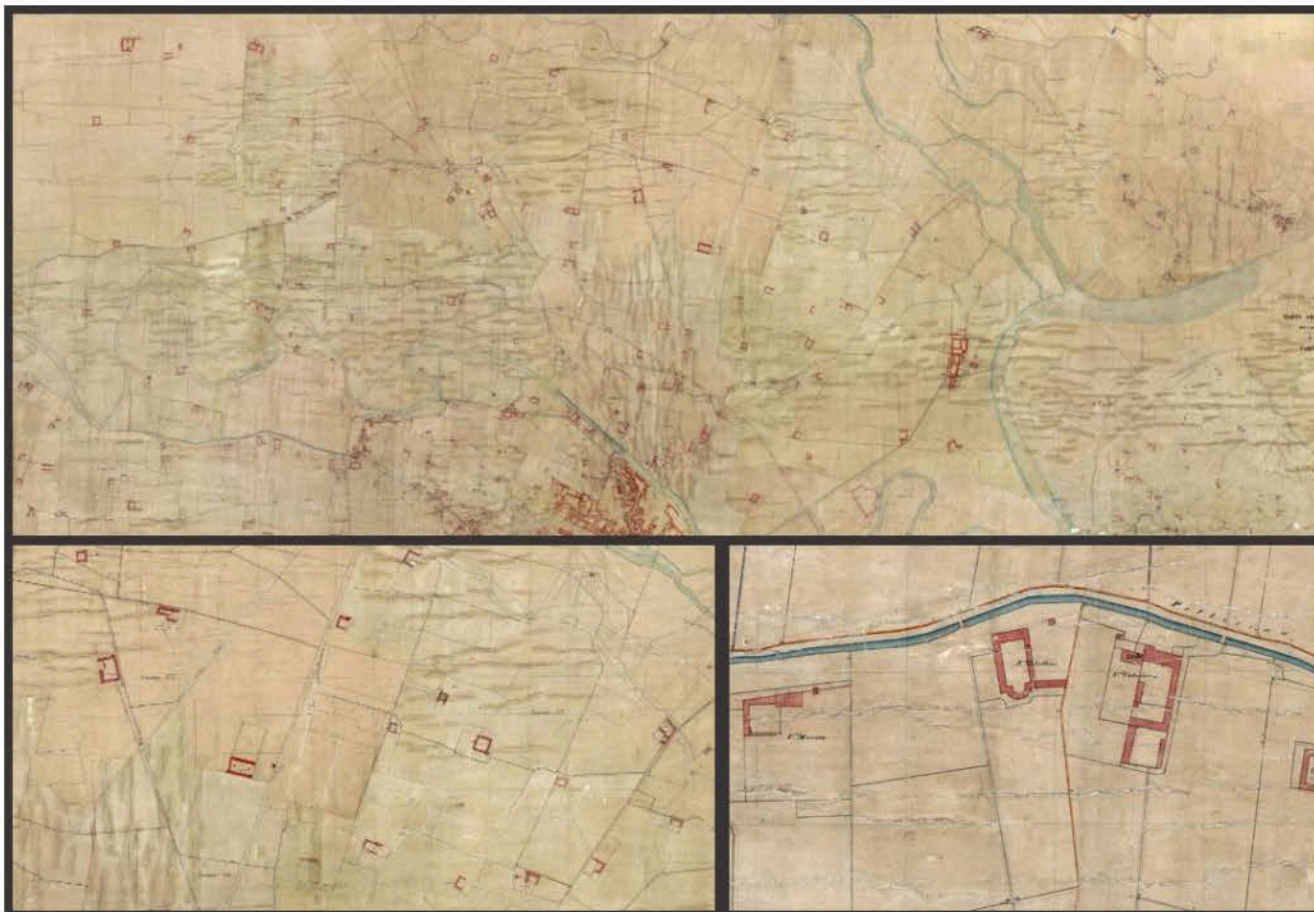
1: Stralci di mappa del Catasto Rabbini, con molteplici ingrandimenti. Si noti la numerosità dei complessi rurali che costellano la cartografia. Torino, Archivio di Stato, Riunite, Finanze, Catasti, Catasto Rabbini, Circondario di Torino, Torino, Fol. XVII.

di protezione su meno di un terzo del totale, nella maggioranza dei casi segnalando solo modesti settori del complesso edificato (più frequentemente la cappella, se presente, e la casa patronale). A prescindere dagli strumenti di legge pochissime sono le forme di valorizzazione relative a questo patrimonio diffuso che, per eccessivi fenomeni di trasformazione o per abbandono, non sembra suscitare corali forme di iniziativa privata e pubblica in loro favore. Il maggior numero di queste costruzioni, ancora in ambienti analoghi o simili a quelli di Ancien Regime , sopravvive, seppur con molte compromissioni, nella zona settentrionale del territorio comunale, al di là del corso del torrente Stura, ove sono presenti molti casi, taluni anche in abbandono, che, almeno ufficialmente, dichiarano immutata la loro originaria vocazione agricola. In forma minore, sul limite estremo occidentale del Comune, a ridosso delle anse della Dora sono altresì riconoscibili taluni lacerti, risparmiati dalle dirompenti aggiunte della città occorse nella seconda metà del Novecento, ma che anche qui denunciano stadi di avanzata precarietà 1 riconducibili agli ultimi decenni.