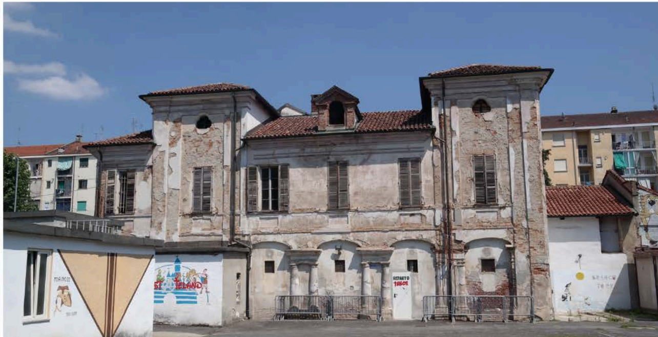
5: Casa patronale della Cascina Lesna, caso esemplificativo dell'assimilazione di un complesso rurale in un sistema urbano altamente densificato, con puntuale reimpiego delle preesistenze considerate degne di conservazione.

Un tema a parte è rappresentato dalle destinazioni d'uso cui sono state convertite queste costruzioni, laddove i casi più fortunati sono rappresentati dai complessi ove la coesistenza tra antico e nuovo è divenuta stratagemma per insediare servizi di utilità collettiva o ancora