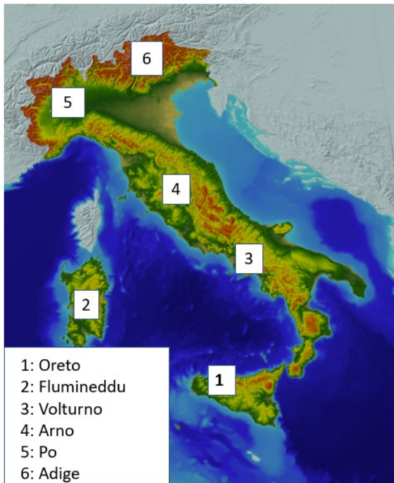
Figura 2: Le sei regioni di studio.

A tale scopo verranno utilizzate due metodologie distinte. Nel caso dell'ensemble di modelli CPM, le simulazioni storiche sono disponibili sul decennio 1996-2005. Queste serie temporali sono troppo brevi per fornire statistiche affidabili sugli estremi se analizzate utilizzando la tradizionale teoria dei valori estremi. Questa limitazione può ora essere superata sfruttando un recente sviluppo nel campo della teoria dei valori estremi: la distribuzione metastatistica dei valori estremi (Marani e Ignaccolo, 2015; Zorretto et al., 2016; Marra et al., 2019), che permette di ridurre drasticamente l'errore di campionamento sfruttando la disponibilità dei dati da eventi ordinari (non massimi annuali). Nel caso invece del modello VHR-PRO_IT, per il quale è disponibile una serie di dati trentennale in periodo storico, verranno utilizzate le tecniche classiche basate sulla teoria del valore estremo e sulla disponibilità di ampie serie osservate di massimi annuali di diversa durata.