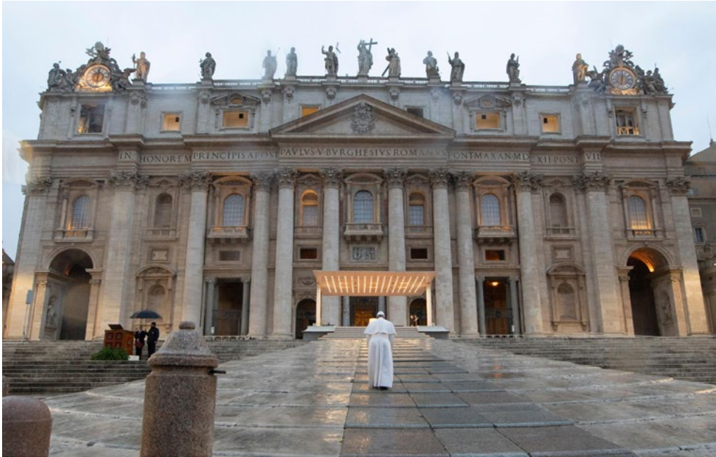
1: 27 marzo 2020 la preghiera planetaria di papa Francesco. Il sagrato di piazza San Pietro e un uomo solo.

progettazione del paesaggio, ai sistemi informativi per la elaborazione delle informazioni, alle strategie di interazione tra i musei e le arti contemporanee: insieme cercano di costruire strategie nuove, collaborative e intersettoriali, per affrontare l'interdisciplinarietà del patrimonio culturale e naturale nella sua complessità ricca e inscindibile e condividere i risultati della ricerca come servizio per la società [Tamborrino et al. 2022]. Evidenziando nuovi tipi di comportamenti culturali e usi rinnovati e rivisitati di spazi con al centro il desiderio, espresso direttamente o solo accennato ma sempre perseguito, di rilanciare quel senso di comunità che la pandemia stava minacciando. E il luogo privilegiato di tale rilancio si è rivelato il digitale (Fig. 1).