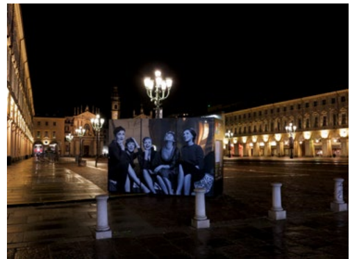
5: Le installazioni di: "Girando per Torino" nel marzo 2020: Piazza CLN e Profondo Rosso (a sinistra); piazza San Carlo e Le amiche (a destra).

possibili molteplici, ulteriori spunti di analisi con la apertura di varie cornici e nuove narrative 17 .