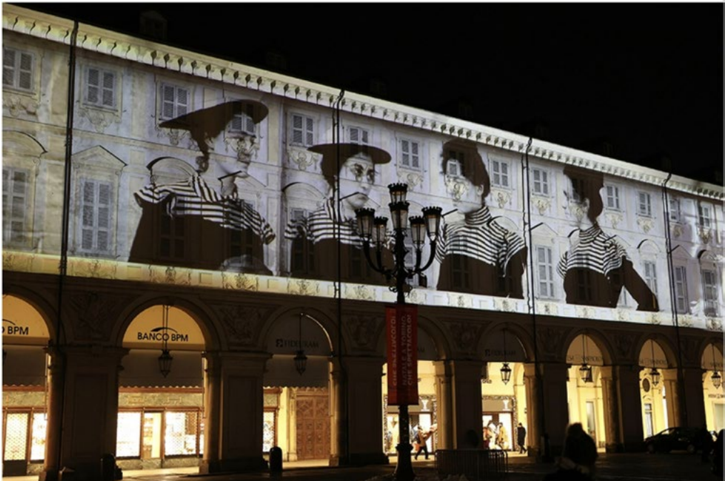
3: Piazza San Carlo: Videomapping Torino Città Dinamica. Due secoli d’arte in città (28 dicembre 2022).

I legami tra le diverse forme d’arte accomunate dal digitale e confluite in varie manifestazioni culturali nella pandemia, costituiscono un patrimonio di resilienza, sviluppando efficacemente energia e innovazione; la possibilità della loro ripetitività ne rende