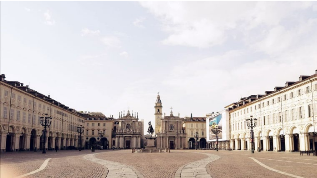
2: Piazza San Carlo il 12 marzo 2020 (@Maria Delia Rojo).

centro di documentazione, divulgazione e luogo di confronto con la specifica vocazione di sollecitare il dibattito sulle trasformazioni della città e i suoi progetti urbani 12 ; si possono rileggere, attraverso il filtro del lockdown , quei luoghi che maggiormente hanno contribuito a definire l'identità cittadina 13 , e ancora i molteplici progetti di rappresentazioni di spazi urbani legate a luoghi della città particolarmente significativi per i diversi ruoli che hanno assunto nel contesto della sua storia. Sono immagini che permettono una riflessione a posteriori su spazi cristallizzati, sospesi e quasi immutabili aperti ora a nuove interpretazioni progettuali o comunque a rinnovate istanze urbane sia in termini ambientali, sia in termini sociali [Capuano 2020; Salizzoni 2021]. Una riflessione che è diventata recupero di eredità perdute proprio nel momento in cui l'accesso fisico a tali luoghi è stato negato, facendo emergere un nuovo modello di rappresentazione della Torino del XXI secolo (Fig. 2).