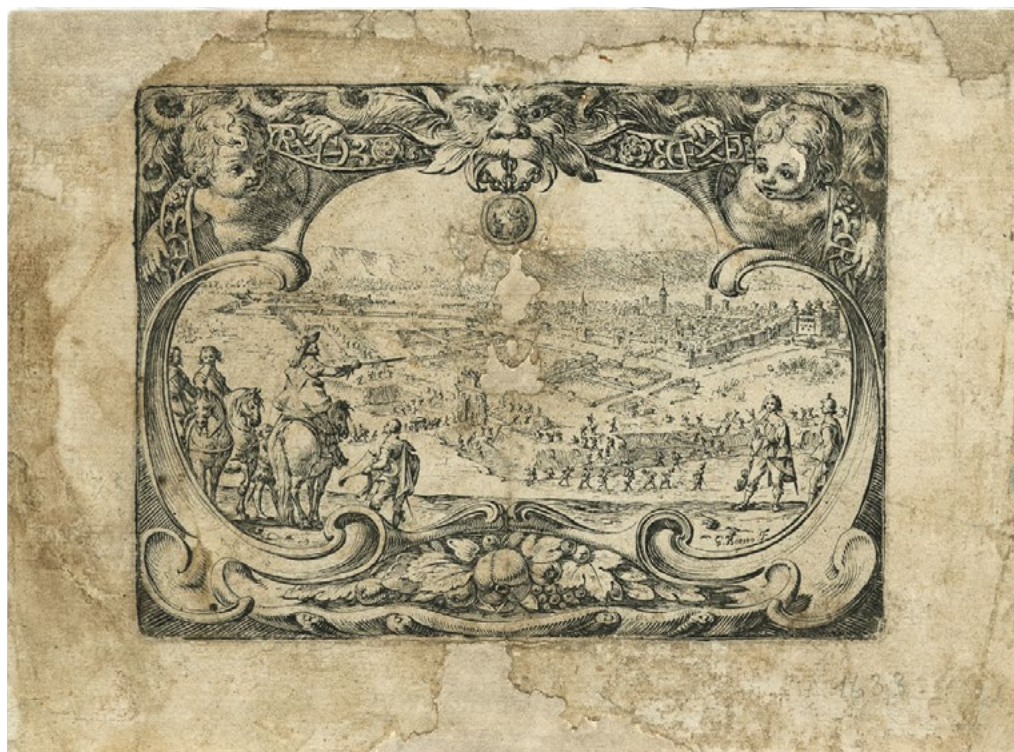
3: Giovenale Boetto. I lavori per il primo ampliamento, la fortificazione, la Porta Nuova. Torino. Archivio Storico della Città, Collezione Simeom D 142.

strada tra i due accessi a Torino 6 . In alcuni fogli, Carlo è qui detto «ingegnere di S.A. soprintendente di d.a porta» 7 . I lavori, eseguiti da maestranze piemontesi e lacuali, sono a carico del Comune, motivo di tensione tra i due poteri e pure ragione del lungo protrarsi della costruzione che, di fatto, non sarà conclusa se non nel 1622, due anni dopo il matrimonio di Vittorio Amedeo e Cristina di Francia (Fig. 2).